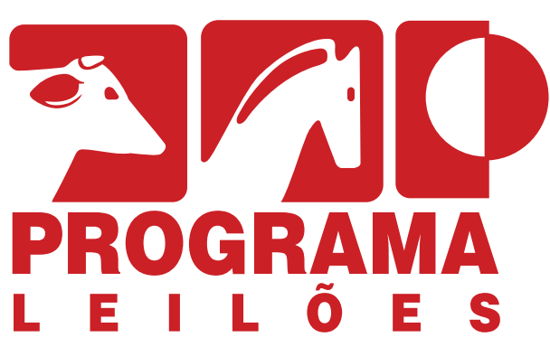
LOGO VERTICAL - VERSÃO ÚNICA