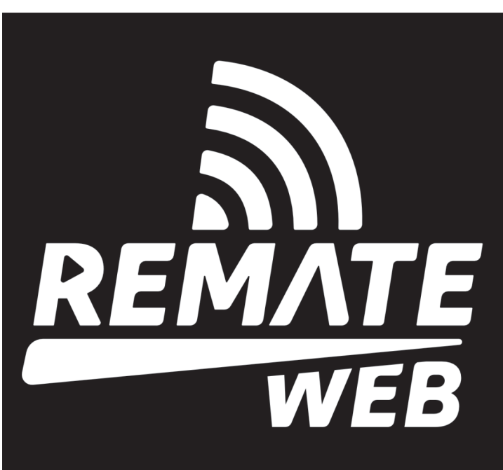
CONTROLE DE FUNDOS / APLICAR A VERSÃO EM PRATA