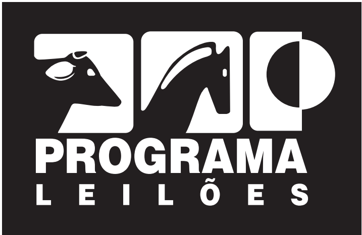
CONTROLE DE FUNDOS / APLICAR A VERSÃO EM BRANCO