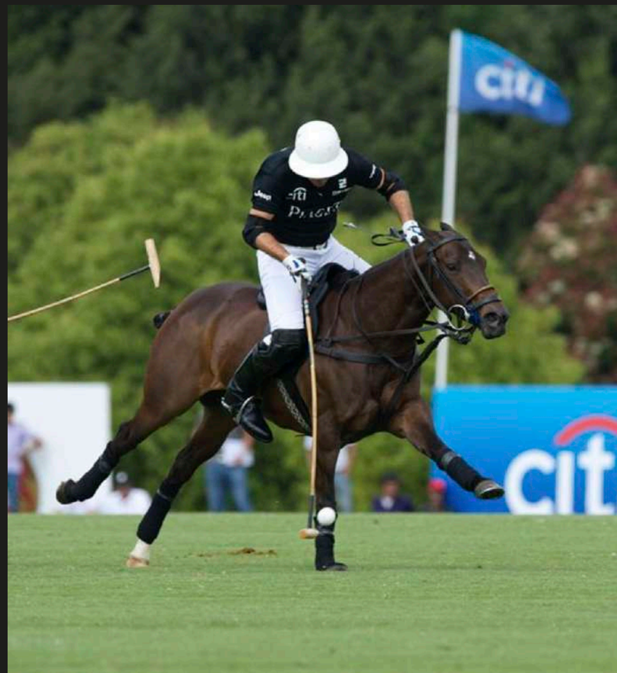
Open So Easy