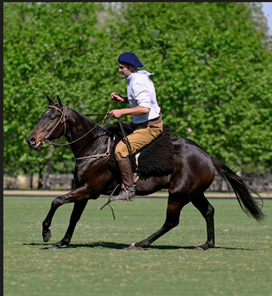
Taita Claro (ganhão)

(Dolfina Cuarteto x Taita Fácil) Cria Marmen