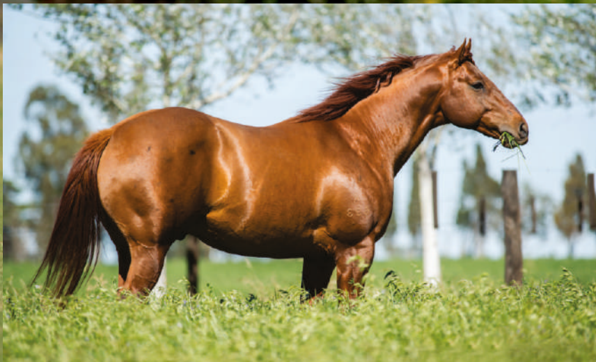
Pai: Open Messi