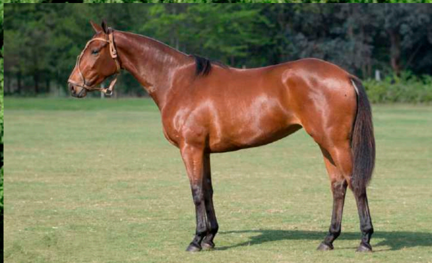
Mãe: Taita Piadosa