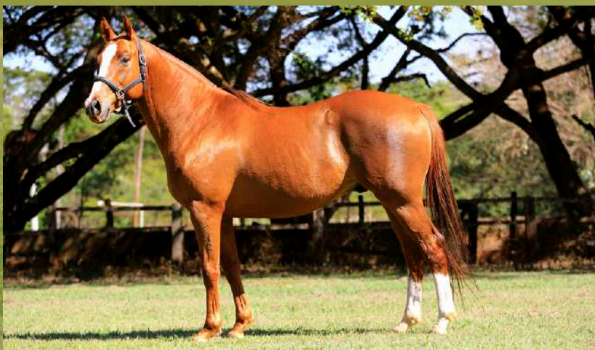
Pai: Peña Cronos