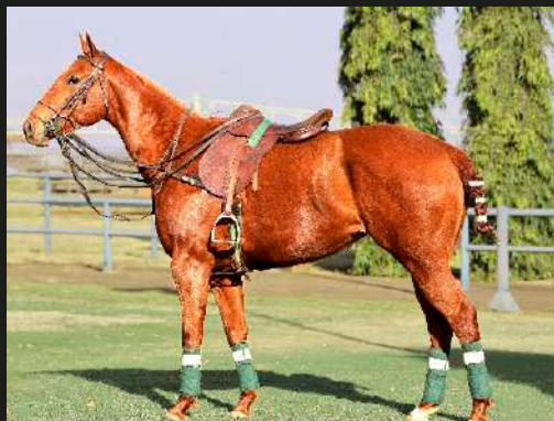
Dolфина Banda 21

Animais adquiridos em 2013, 2014, 2015, 2016, 2017 e 2018