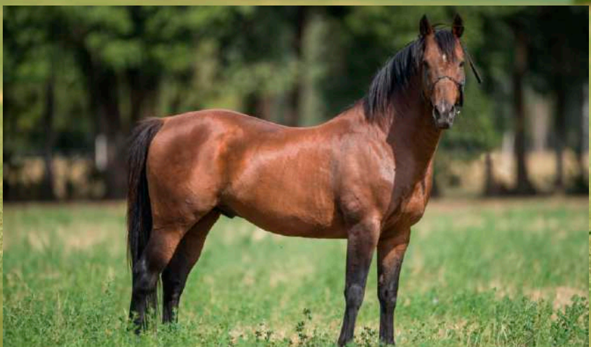
Pai: Open Tornado