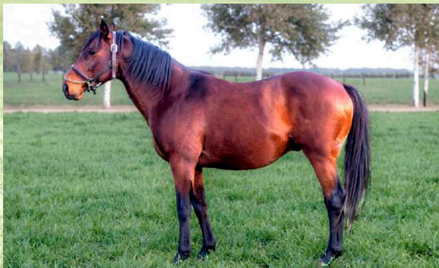
Pai: Fino Shark