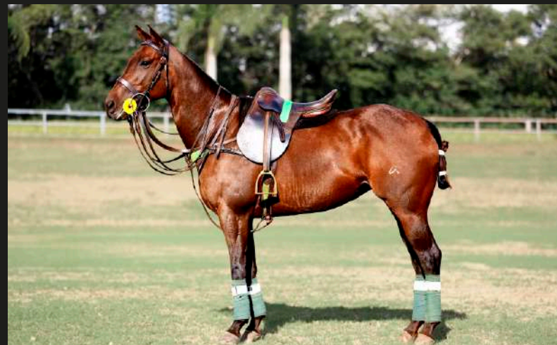
Mar Men Florence (Fino Cool x Machitos Jacinta)