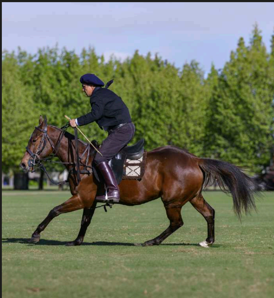
Taita Easy Girl