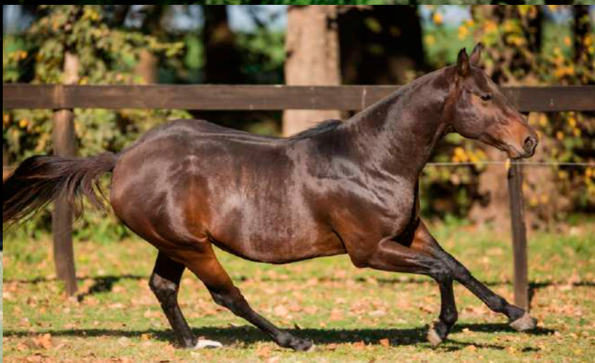
Pai: Taita Orador