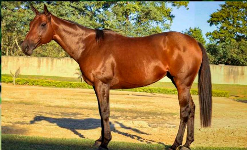
Mãe: Taita Lujuria