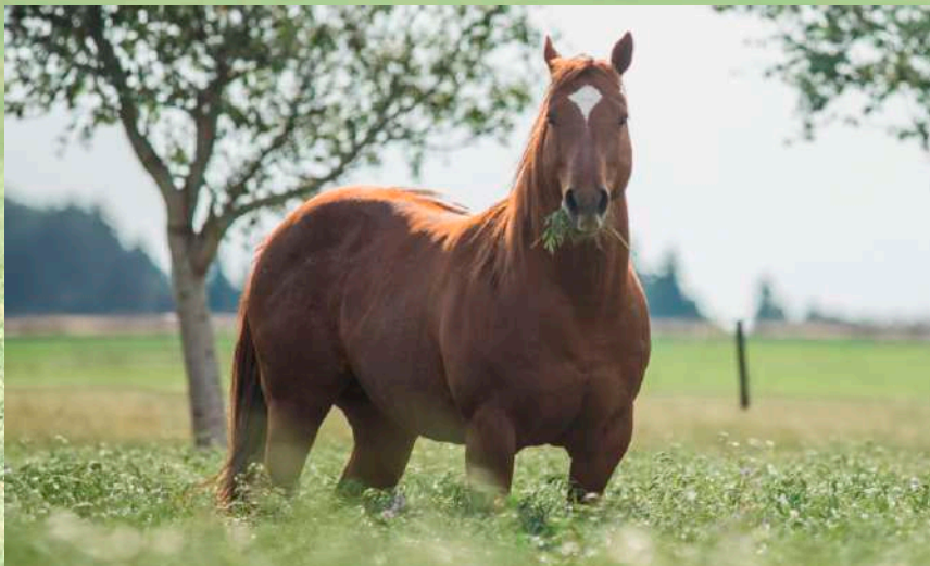
Pai: Open Iluminado