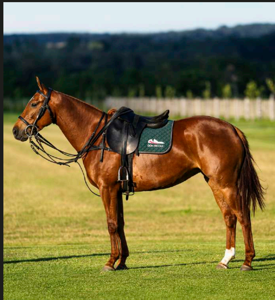
Don Ercole Crossover (Open Chalino x Lovelocks Cross Drum)