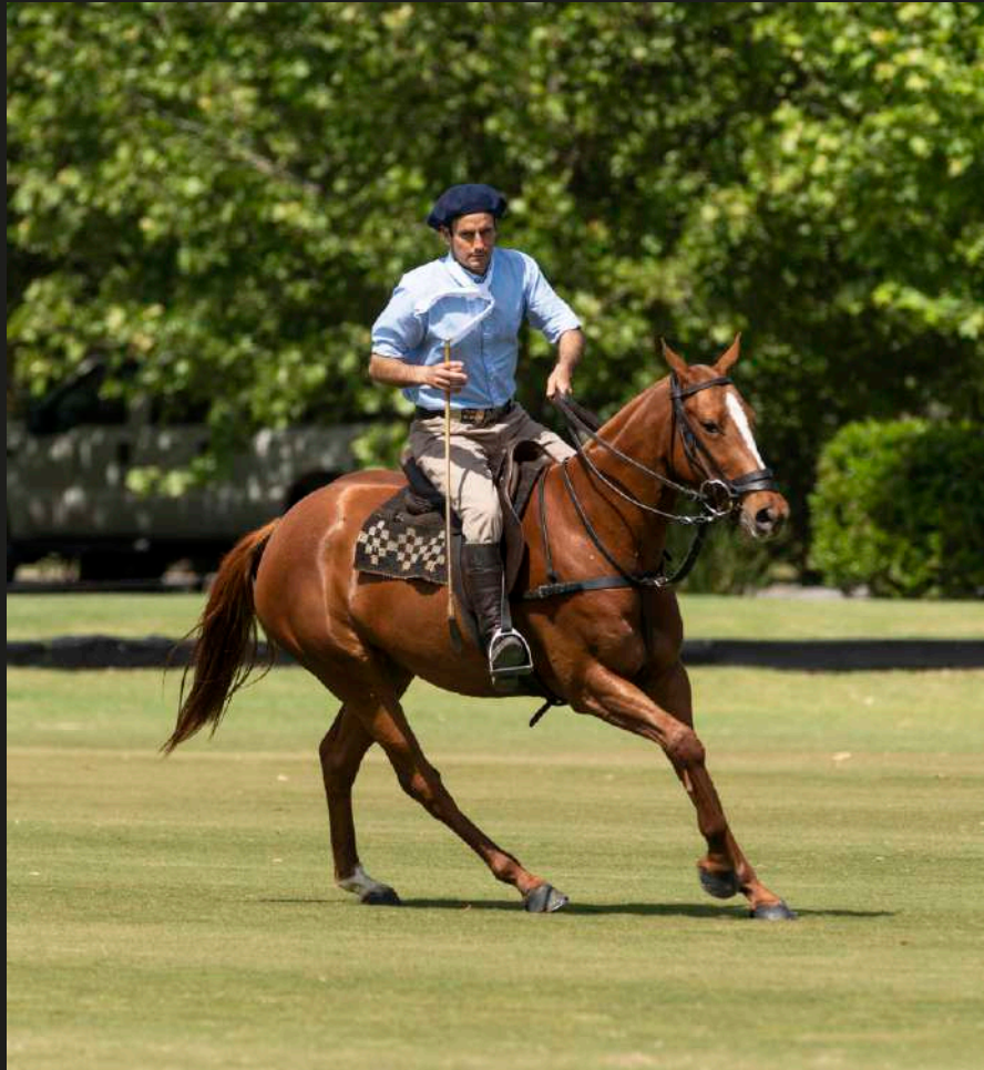
Taita Franchela (Dolfina El Messi x Open Chela)