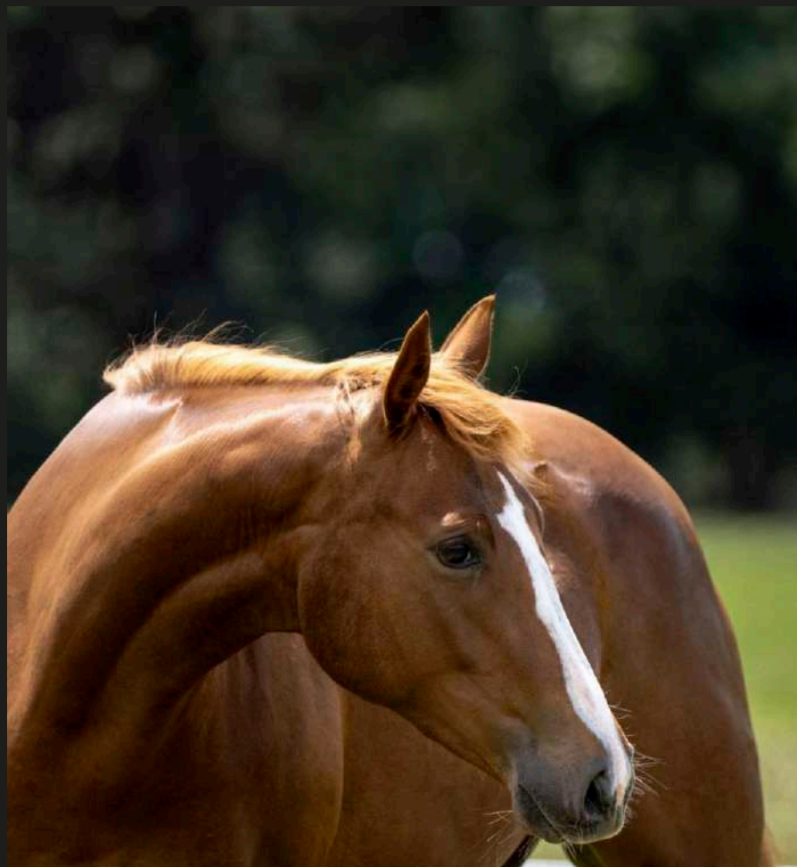
Latia La 10 (Open Malbec x Open Exacta)