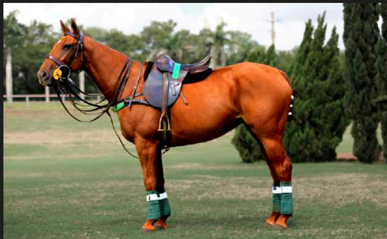
Mar Men Flor (Fino Cool x Dolфина Maléfica)