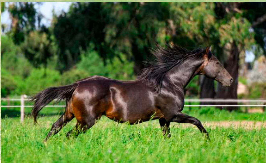
Pai: Monjita Cosaco