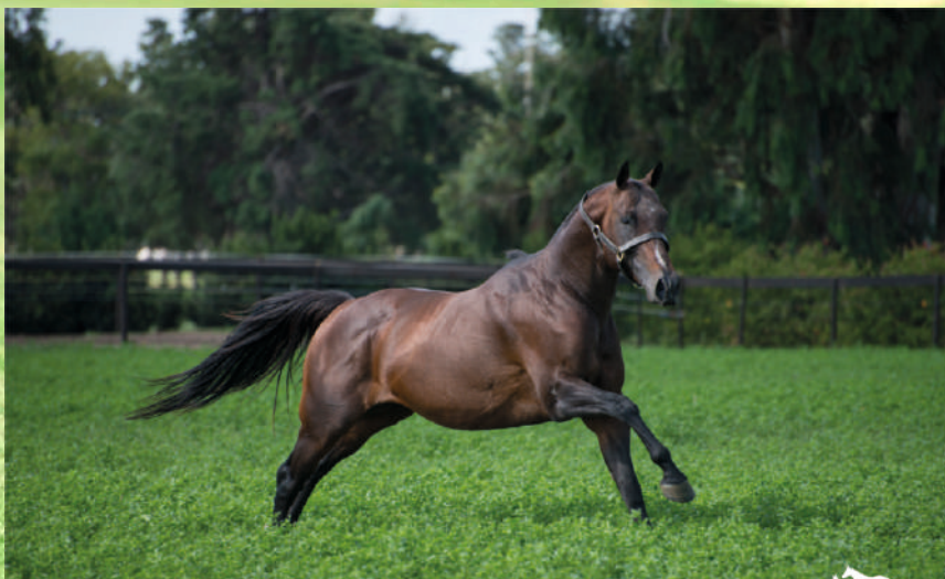
Pai: Dolfina El Messi