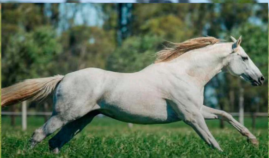
Pai: Machitos Andino