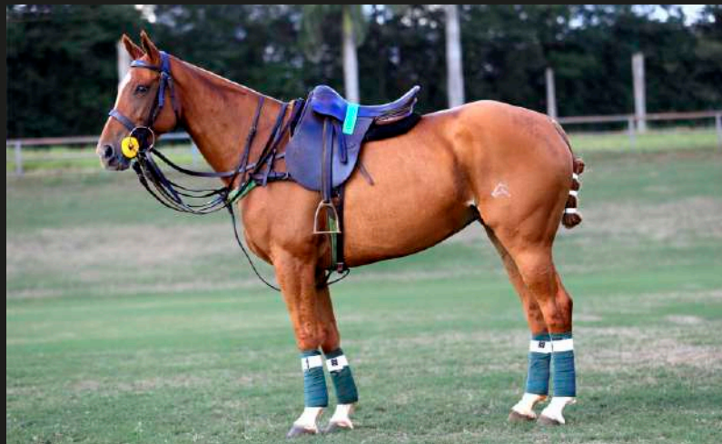
Mar Men Fada (V8 Religioso x Open Trampa)