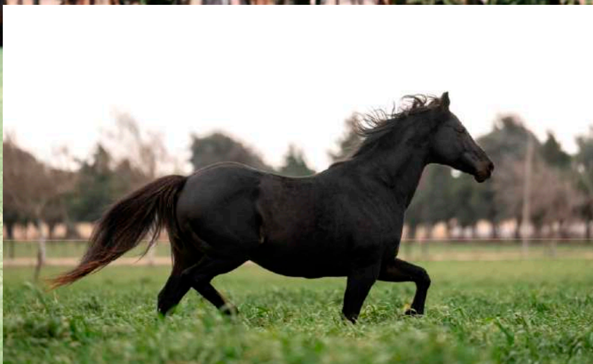
Pai: Don Rockero