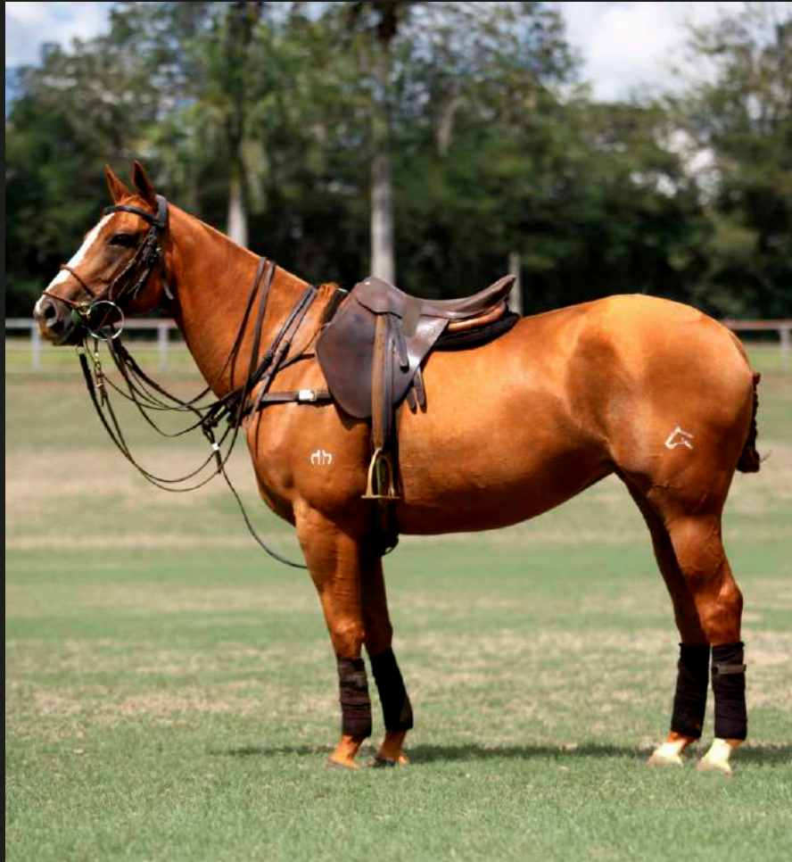
Mar Men Érika (Ellerstina Picaro x Open Trampa)