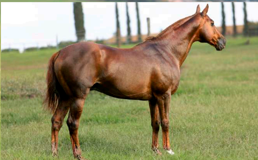
Pai: Fino Merlot