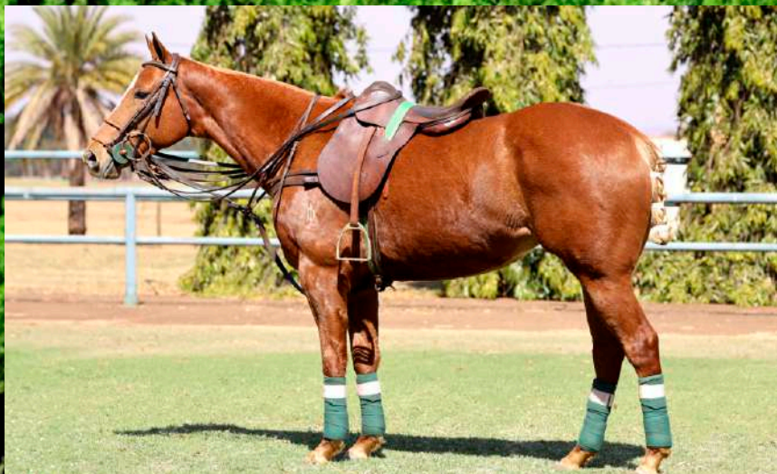
Mãe: Dolfina Dubai