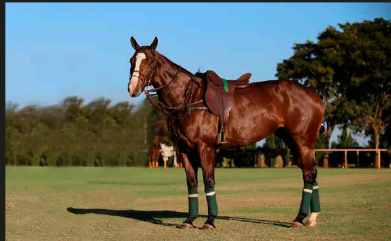
Mar Men Adidas (Open Poncho x Cespedera)