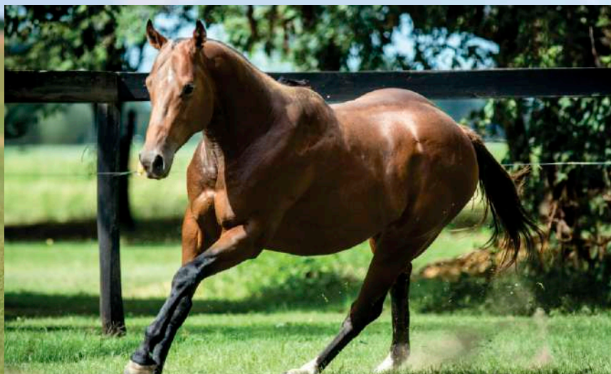
Pai: Dolфина Zidane