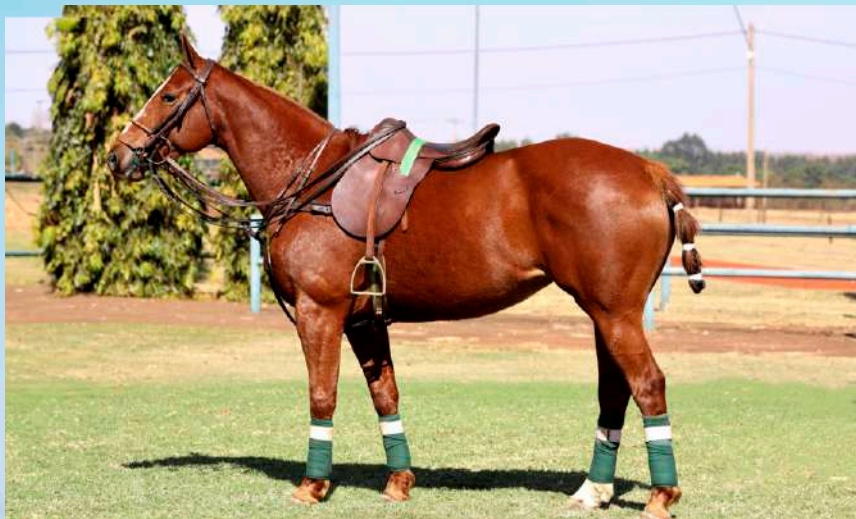
Mãe: Dolфина Gran Diosa