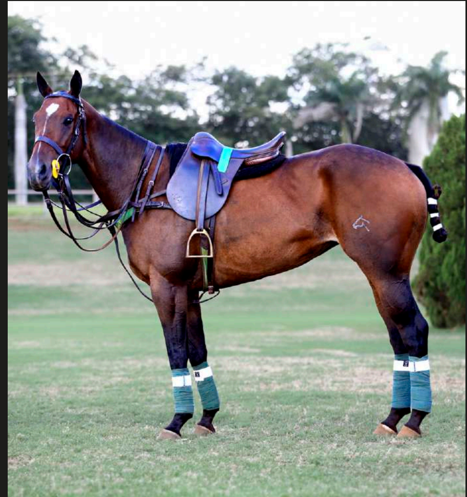
Mar Men Felicidade (Machitos Chelo x Machitos Vanity)