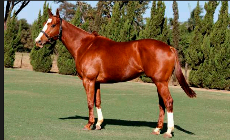
Ve Ocho Sisi