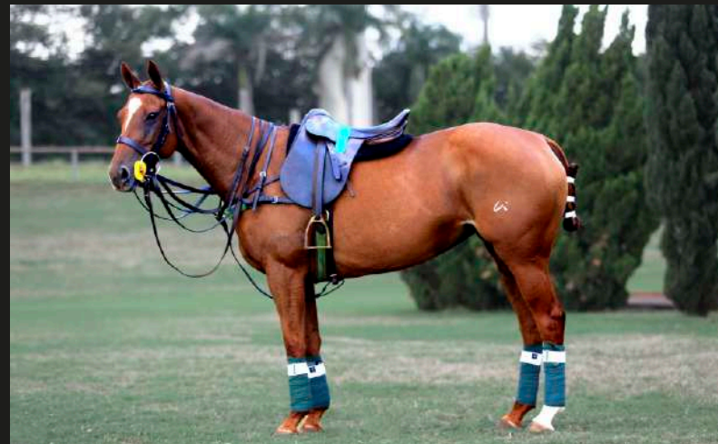
Mar Men Fitah (Open Iluminado x Dolфина Maléfica)