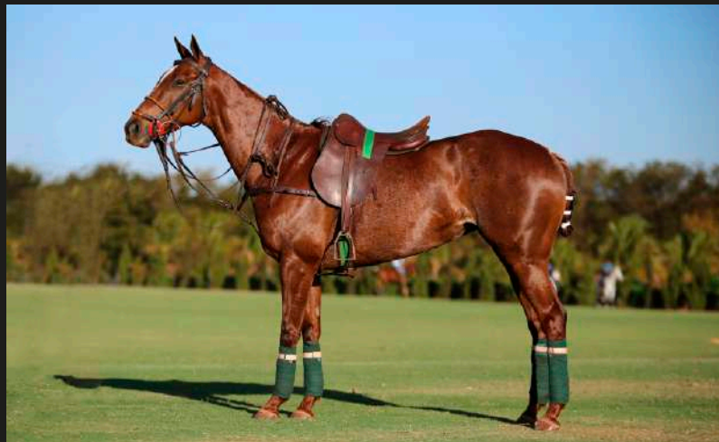
Mar Men Aluna (Open Iluminado x V8 Via Láctea)