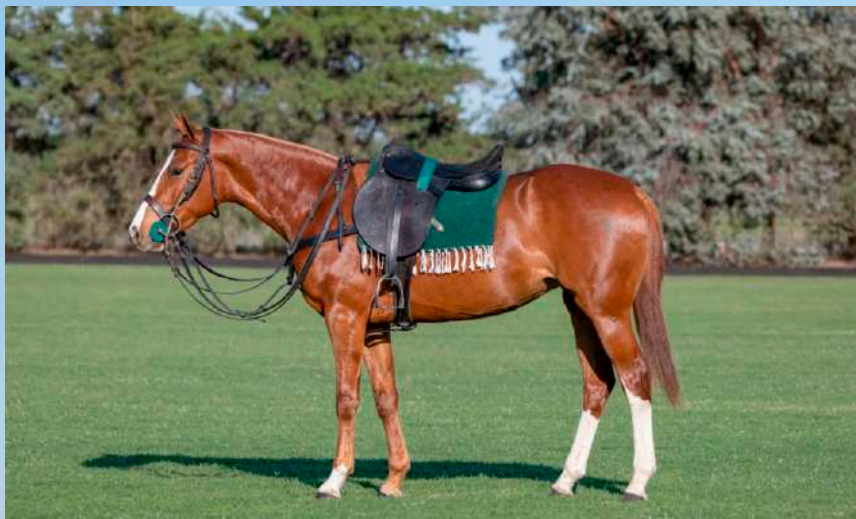
Mãe: Taita Portuaria - Clon1