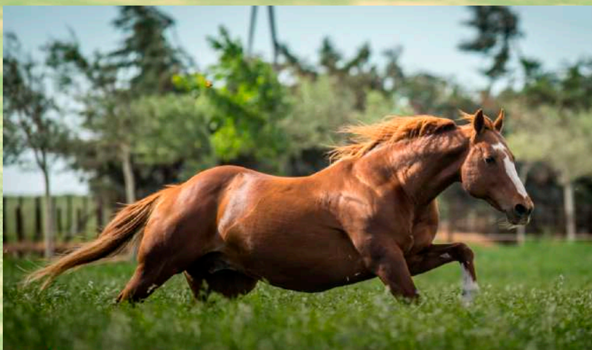
Pai: Machitos Chelo