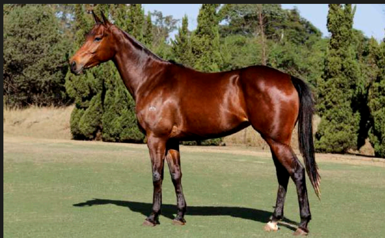
Mar Men Anita (Open Chimento x Dolfina Centuria)