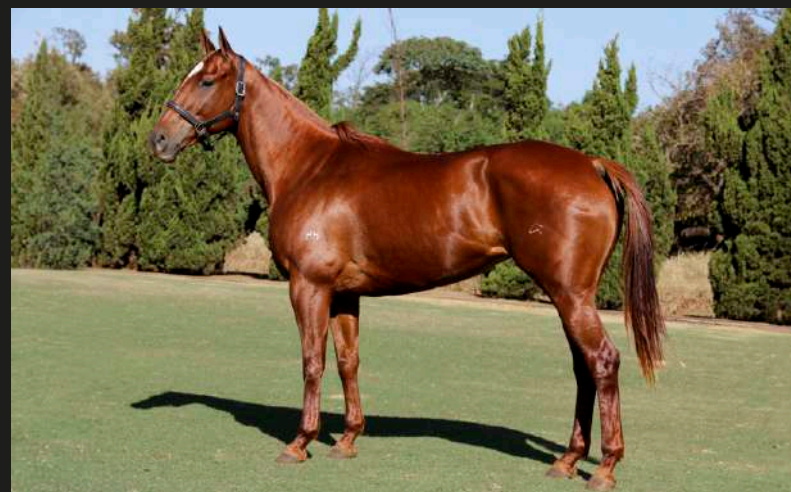
Mar Men Adocicada (Machitos Chelo x Canosa)