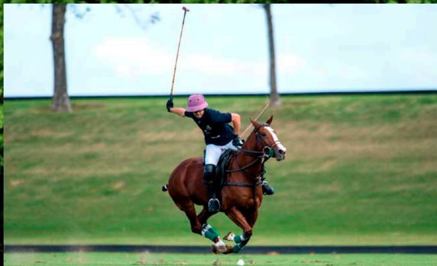
Mãe: Ve Ocho Sisi