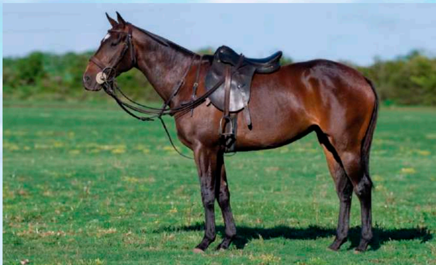
Mãe: Taita Holgazana