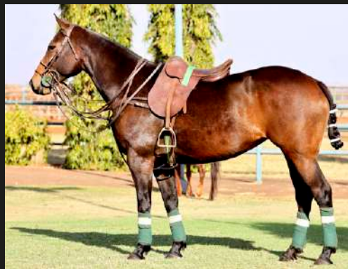
Dolфина Por Siempre Cuartetera