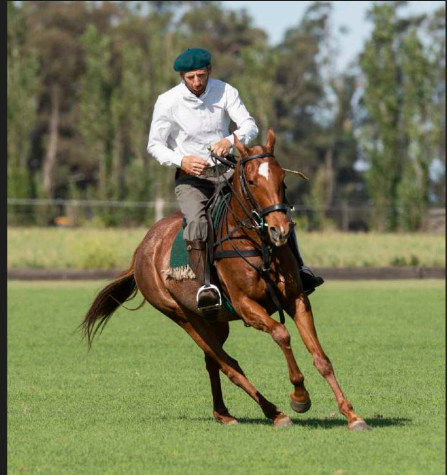
Taita Calandria (Open Iluminado x Taita Bachata)