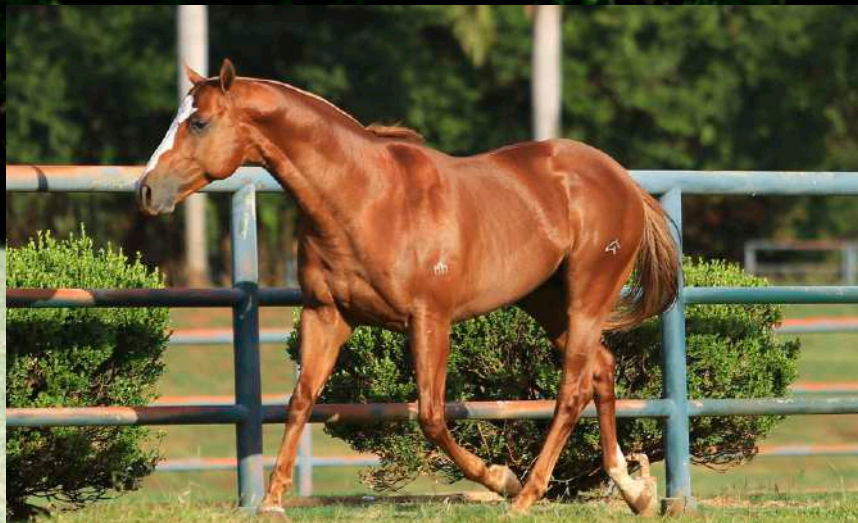
Pai: Hcol Gin