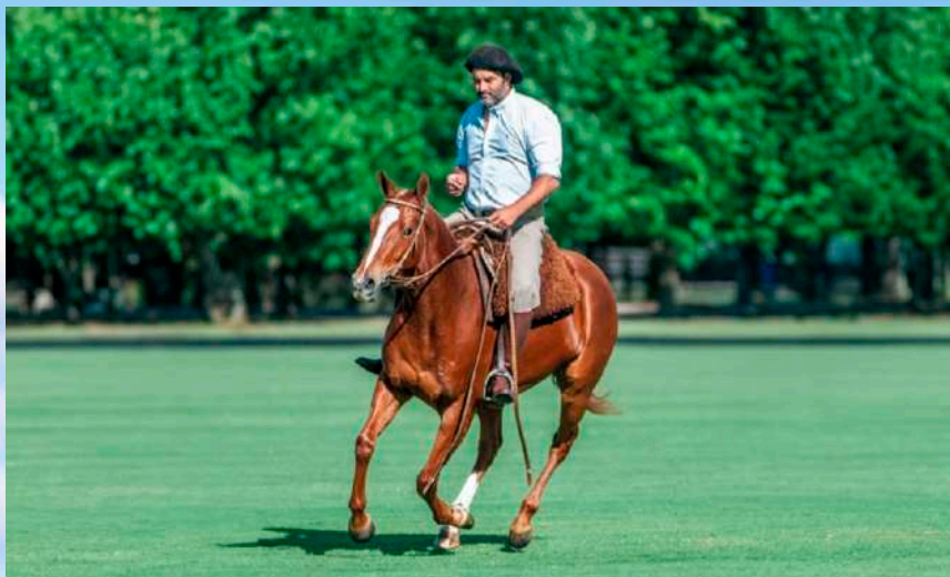
Mãe: Taita Learjet