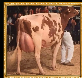
JEN GENA DEBONAIR RED - MB88

AVÓ: J.E.N. BONECA SEPT.-TE - MB88 05.01 3X 365D 16.348L 2,52G 3,46P