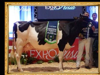
BUR JR HELIOCITA 2109 - MB88

AVÓ: BUR JR. HELIOCITA 3164 - EX91 04.02 3X 365D 11.985L 3,94G 3,04P