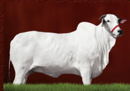
ESPAÑHOLA J.GALERA (bisavó da doadora)