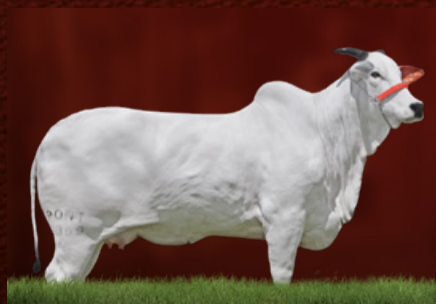
JORDÂNIA XXVII FIV PONTAL (mãe da doadora)