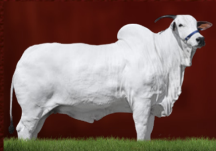
TURBINADA 9 TE GUADALUPE (avó)