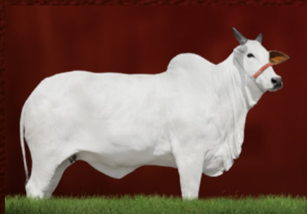
KERIDÍSSIMA FIV LAVRINHA (mãe da doadora)

LEGAT DA SABIÁ KERIDÍSSIMA FIV LAVRINHA JORDÂNIA II TE J.GALERA