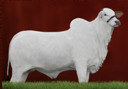
HEMATITA III AGHROZ (avó da doadora)