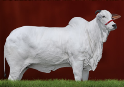
BOEMIA DA MUNDIAL (mãe)

1646 DA MN TURBINADA 9 TE GUADALUPE J.E.N. ILARA TE