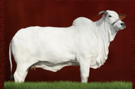
J.E.N. ILARA TE (bisavó)