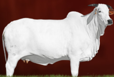
SALINA FIV DA HRO (mãe)