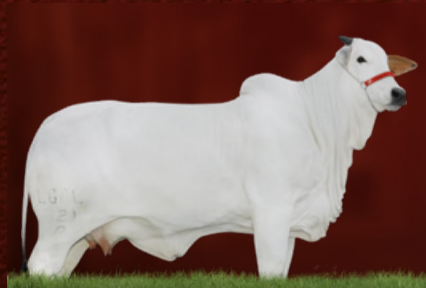
CHERRY 2 FIV DA LGAL (mãe)