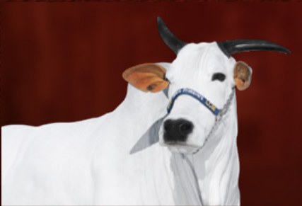
HALINA FIV DA CRUZEIRO II