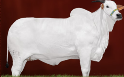
GALÁXIA FIV DA RECREIO (avó)