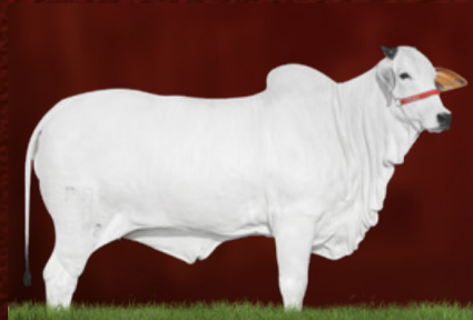
INSTALADA FIV PARANÃ (mãe)