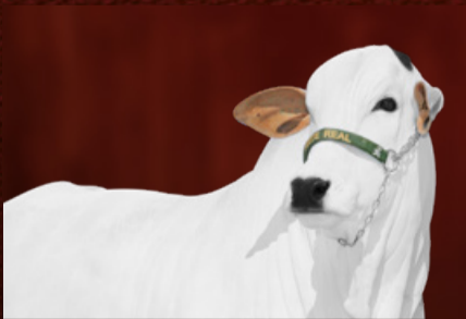
CAYMAN FIV DA RS