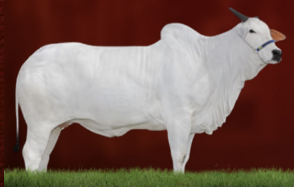
CELESTE (avó da doadora)