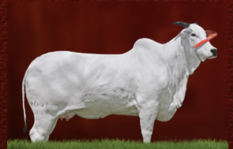
JORDÂNIA XXVII FIV PONTAL (avó)