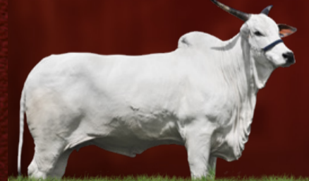
ÓRBITA DA QUILOMBO (bisavó)