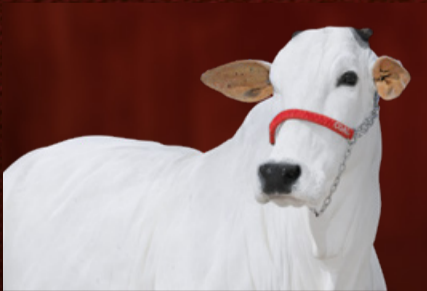
FLAMINGA FIV DO PARANÃ