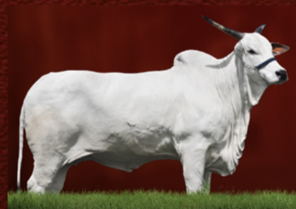
ÓRBITA DA QUILOMBO (bisavó)