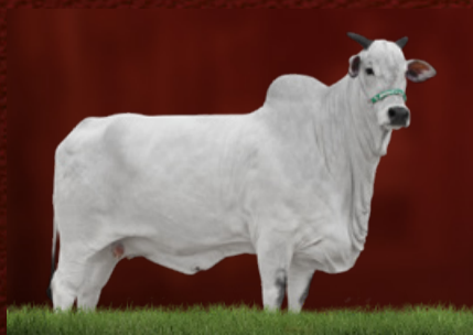
TALINI 4 TE J.GALERA (avó da doadora)