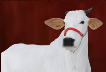
VIATINA IV FIV CGAL