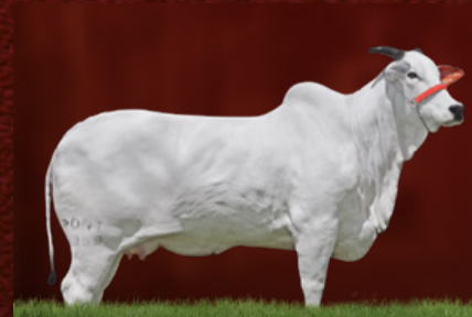
JORDÂNIA XXVII FIV PONTAL (avó)