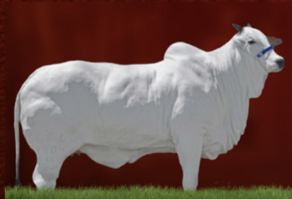
NAFTA FIV DA FAI (mãe)