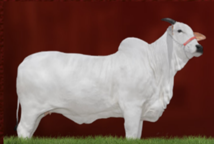
MAHARANY I FIV CGAL (mãe)