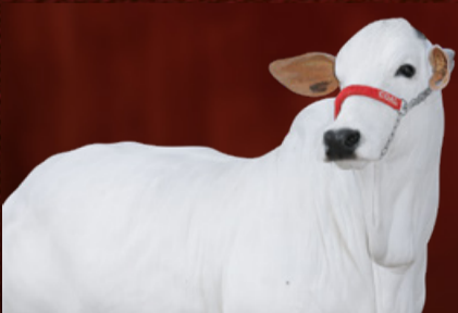
MERITÍSSIMA I-ML FIV CGAL