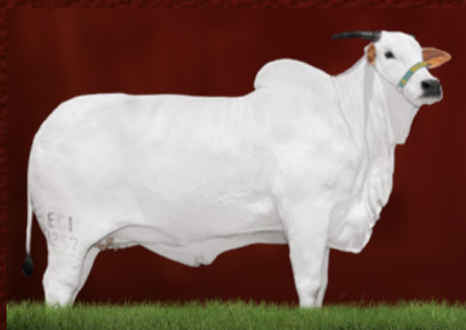
GALÁXIA FIV DA RECREIO (avó)