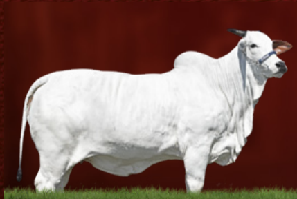
ADINA 1 TE J.GALERA (mãe)