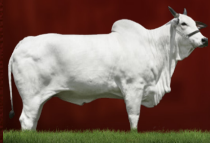
SÉRVIA 9 TE J.GALERA (genética)