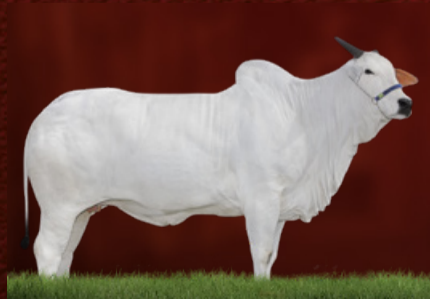
CELESTE (avó da doadora)