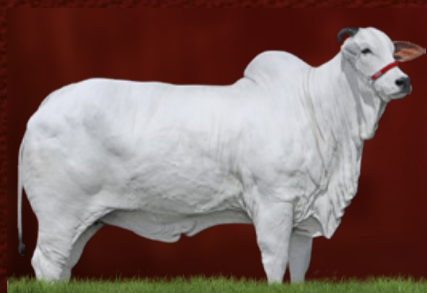
BOEMIA DA MUNDIAL (mãe)