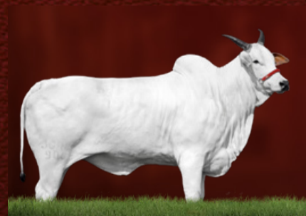
ITÁLIA IV TE J.GALERA (bisavó da doadora)