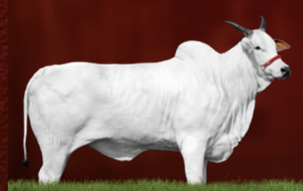
ITÁLIA IV TE J.GALERA (bisavó)