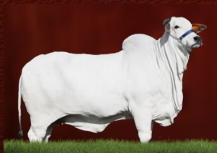
MELOPÉIA TE GUADALUPE (avó da doadora)