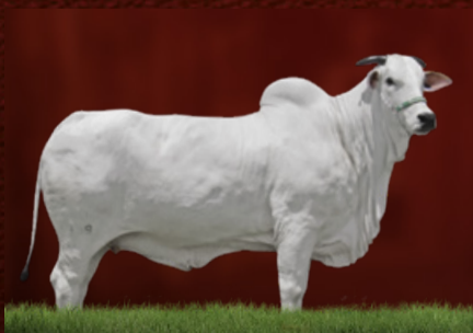
GRANFA FIV SANTA CRUZ (mãe da doadora)