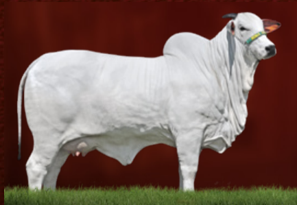
NEVADA FIV RAZO (avó)