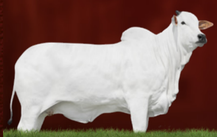
DOMITILA I FIV CGAL (mãe)