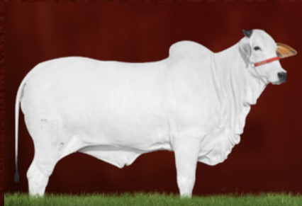
INSTALADA FIV PARANÃ (mãe)