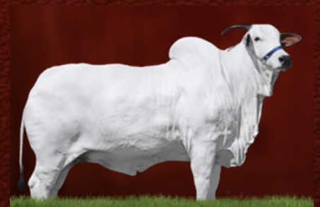
TURBINADA 9 TE GUADALUPE (avó)