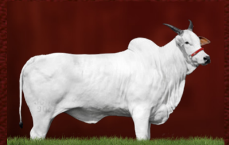
ITÁLIA IV TE J.GALERA (bisavó)