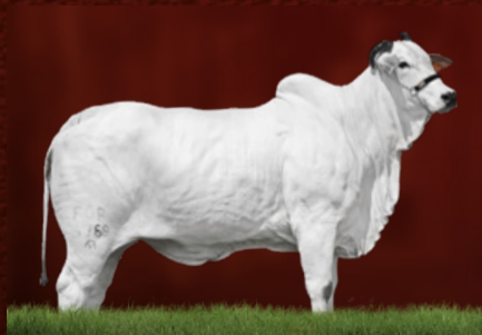
TAHITI TE GUADALUPE (avó)