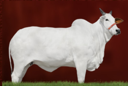
KERIDÍSSIMA FIV LAVRINHA (avó)