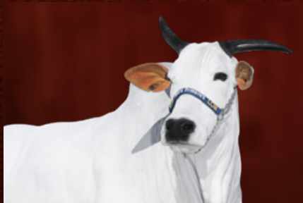
HALINA FIV DA CRUZEIRO II