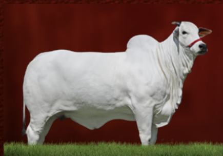
VIENA 3 TE GUADALUPE (mãe da doadora)

HELÍACO DA JAVA LIAKA DA RS I CARTAGENA DA ÔNIX