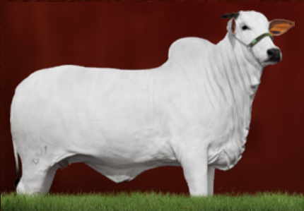
JAVANESA TE GUADALUPE (mãe)