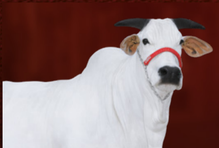
VIATINA IV FIV CGAL