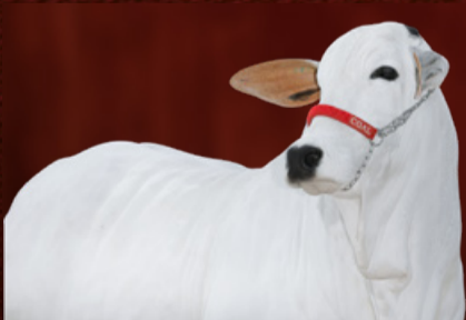
MAHARANY I-III-ML FIV CGAL