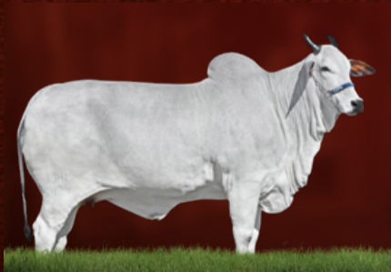
SÉRVIA 8 TE J.GALERA (avó)