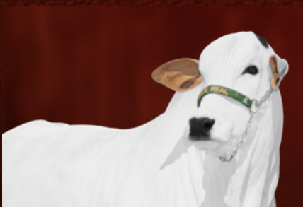
CAYMAN FIV DA RS