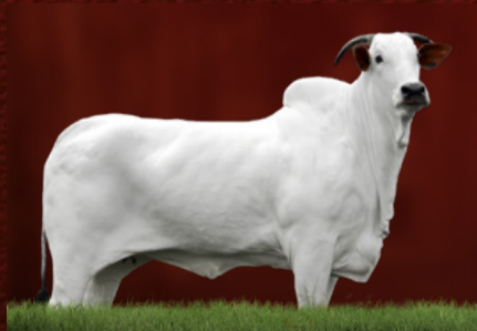
ESSÊNCIA TE GUADALUPE (avó)