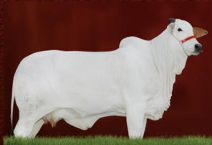
CHERRY 2 FIV DA LGAL (mãe)