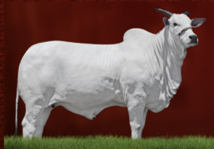
CANETA FIV DO MURA (bisavó)