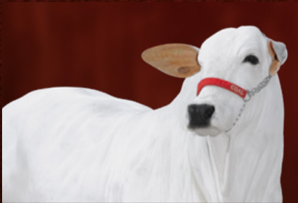
NAFTA I FIV CGAL