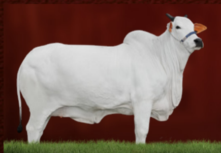
ITÁLIA IV FIV I TAJ (mãe da doadora)

HELÍACO DA JAVA LIKA DA RS I CARTAGENA DA ÔNIX