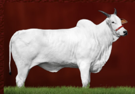
ITÁLIA IV TE J.GALERA (bisavó da doadora)