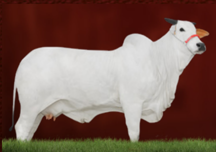
TAYALA 3 TE J.GALERA (mãe da doadora)

BITELO DA SS TAYALA 3 TE J.GALERA MARÉA I TE J.GALERA