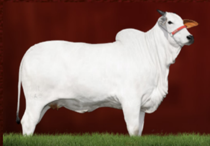
AMROHA TE J.GALERA (avó)