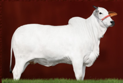
AMROHA TE J.GALERA (mãe)