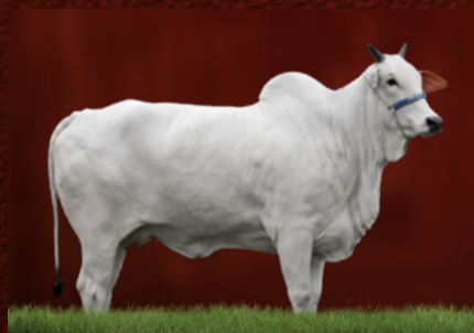
SÉRVIA 7 TE J.GALERA (avó da doadora)