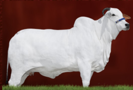
MOGIANA FIV JACURICY (mãe)