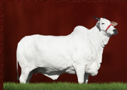
DALINI DA BIONATUS (bisavó da doadora)