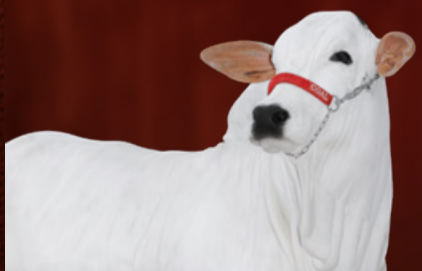
DOMITILA I-III-ML FIV CGAL