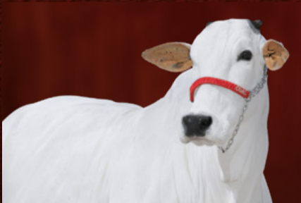
FLAMINGA FIV DO PARANÃ