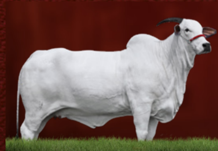
ESPN JAVANESA (irmã)