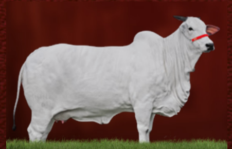
URCA I TE J.GALERA (avó)