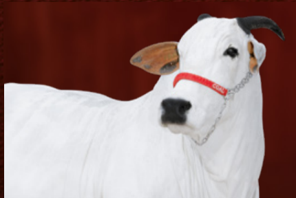
FADINA FIV AL CANAÃ