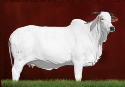
SALINA FIV DA HRO (mãe)