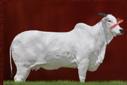
JORDÂNIA XXVII FIV PONTAL (avó)