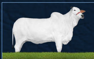
PARLA FIV AJJ - AVÓ