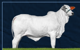
INDIANAPOLIS FIV M. VERDE - FILHA