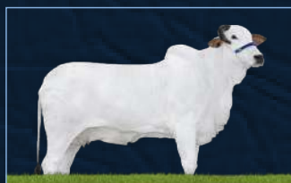
QUALITÁ TE GUADALUPE - MÃE