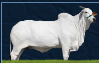
HALLANA FIV SBX - MÃE