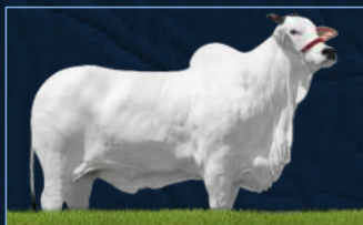
HAVANAH FIV HVP - MÃE

BITELO DA SS NICE ESPINHAÇO ITALIA FIV ESPINHAÇO