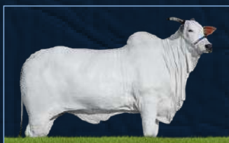
CATTEDRAL FIV CIAV - MÃE