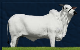
HIERARCA ED ARROJO TE - BISAVÓ