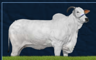
PRADA TE DA SABIÁ - AVÓ