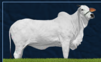
NICE ESPINHAÇO - AVÓ