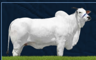
SÉRVIA FIV MRA - AVÓ

BITELO DA SS SÉRVIA FIV MRA SERVIA 8 TE J.GALERA