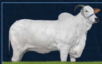
PRADA TE DA SABIÁ - MÃE

FAJARDO DA GB DIMA DA DI GENIO GAMAYANA TE PONTAL