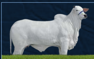
NALISHA II TN1 MACHADINHO - MÃE

BITELO DA SS FADAMY I TE PO FADAMY TE J. GALERA