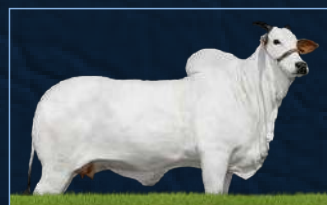
ENDDY TE DA FORT. VR - AvÓ