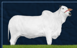
PARLA FIV AJJ - AVÓ