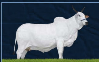
JOLIE FIV DO MURA - AVÓ

BASCO DA SM JOLIE FIV DO MURA ENFEZADA DO MURA