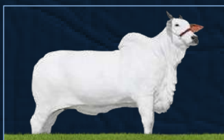
MONTANA FIV DA SABIÁ - MÃE

BIG BEN DA SN PRADA TE DA SABIÁ EUFORIA DA SABIÁ