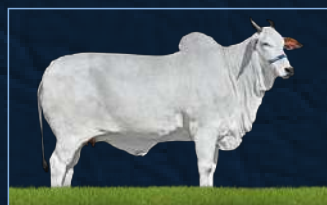
SÉRVIA 8 TE J.GALERA - BISAVÓ