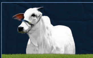
KARLA FIV HVP - MÃE

BITELO DA SS PARLA FIV AJJ JATANY TE AJJ