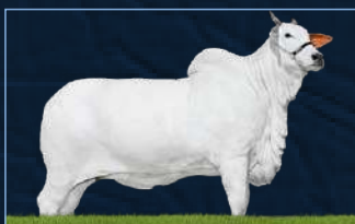
MONTANA FIV DA SABIÁ - IRMÃ