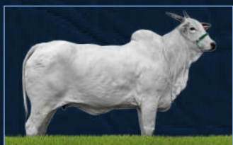
TESSENCIA FIV M. VERDE - MÃE

ENLEVO DA MORUNG. ESSENCIA TE GUADALU. TN2 HIERARCA ED ARROJO TE