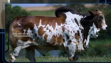
REPRODUTOR - PAI DA PRENHEZ