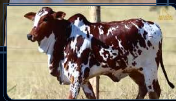
NETA - CHIARA MACF