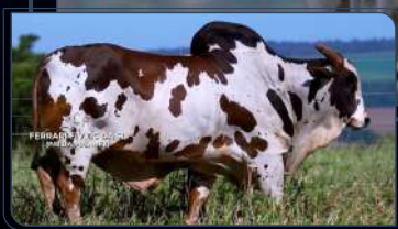
REPRODUTOR - PAI DA PRENHEZ