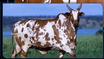
FILHA - MÃE DA CHIARA MACF