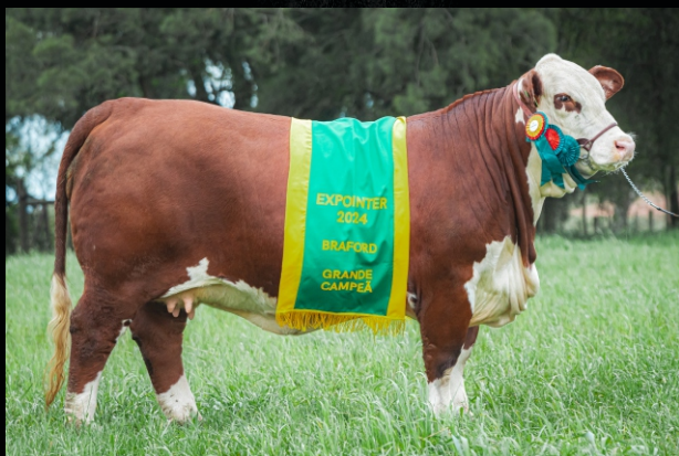
Grande Campeã Expointer 2024