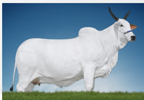
JOLIE FIV DO MURA (avó)