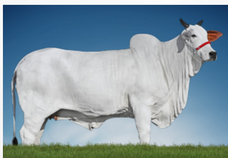
TUANI FIV DO MURA (mãe)