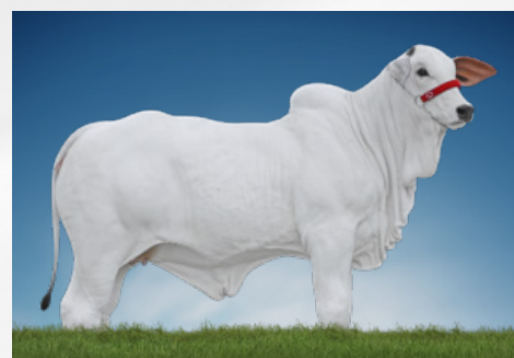
FINLÂNDIA DA ANP (irmã)