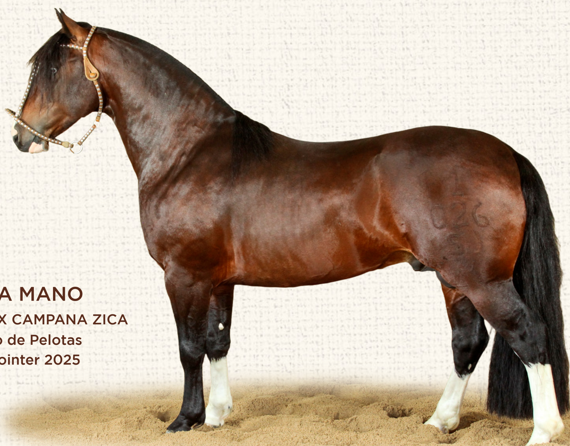
SJ MANO A MANO