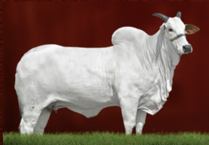
ENDDY TE DA FORT.VR (avó)