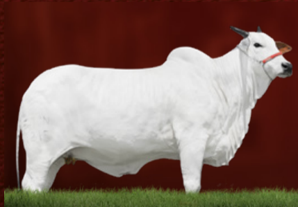
DALLA FIV DA EAO (mãe)