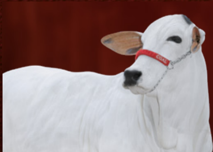
INSTALADA IV FIV CGAL