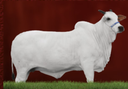
VENA DA ZEB.VR (bisavó)