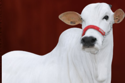
DALLA VI-ML FIV CGAL