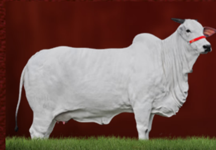
URCA I TE J.GALERA (avó)