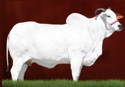
ICARA FIV SANTA CRUZ (mãe)