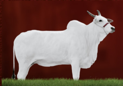
ÓPERA DA SC (avó)