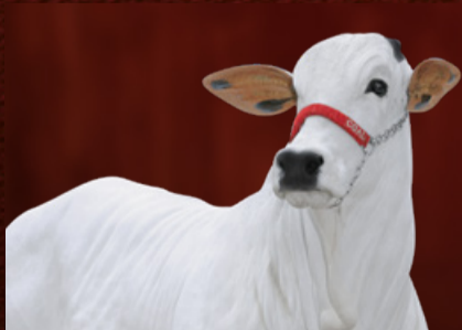
BEVERLY FIV BSP