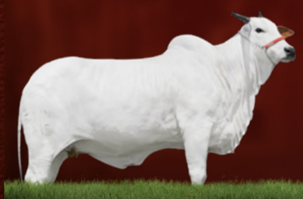
DALLA FIV DA EAO (mãe)