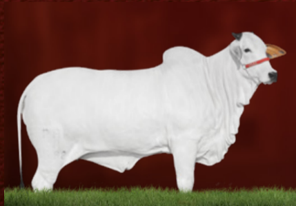
INSTALADA FIV PARANÃ (mãe)