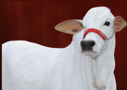
BAVÁRIA 1-IV FIV CGAL