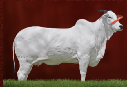
JORDÂNIA XXVII FIV PONTAL (avó)