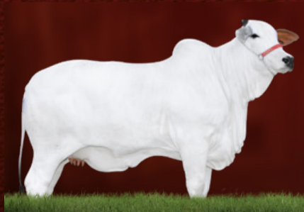
VERDANA XXIV FIV CGAL (mãe)