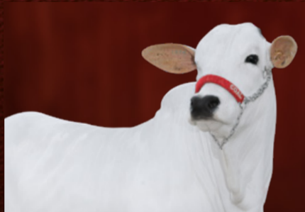
ICARA II-ML FIV CGAL