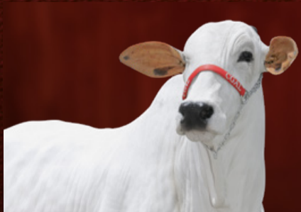
VERDANA XXIV-II FIV CGAL