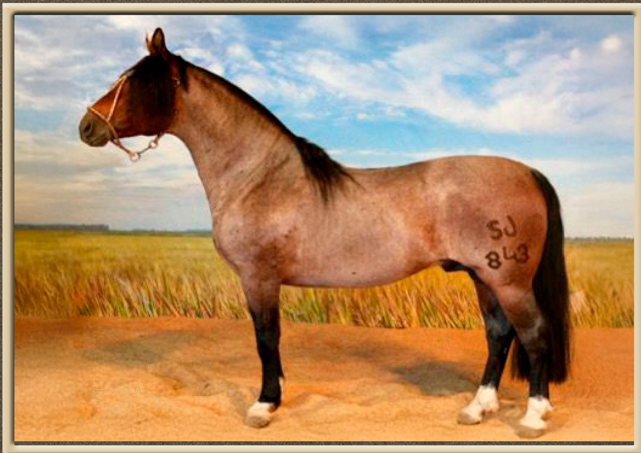
SJ FARROUPILHA CAPITÃO DO PURUNÃ X ATREVIDA DO GAITEIRO