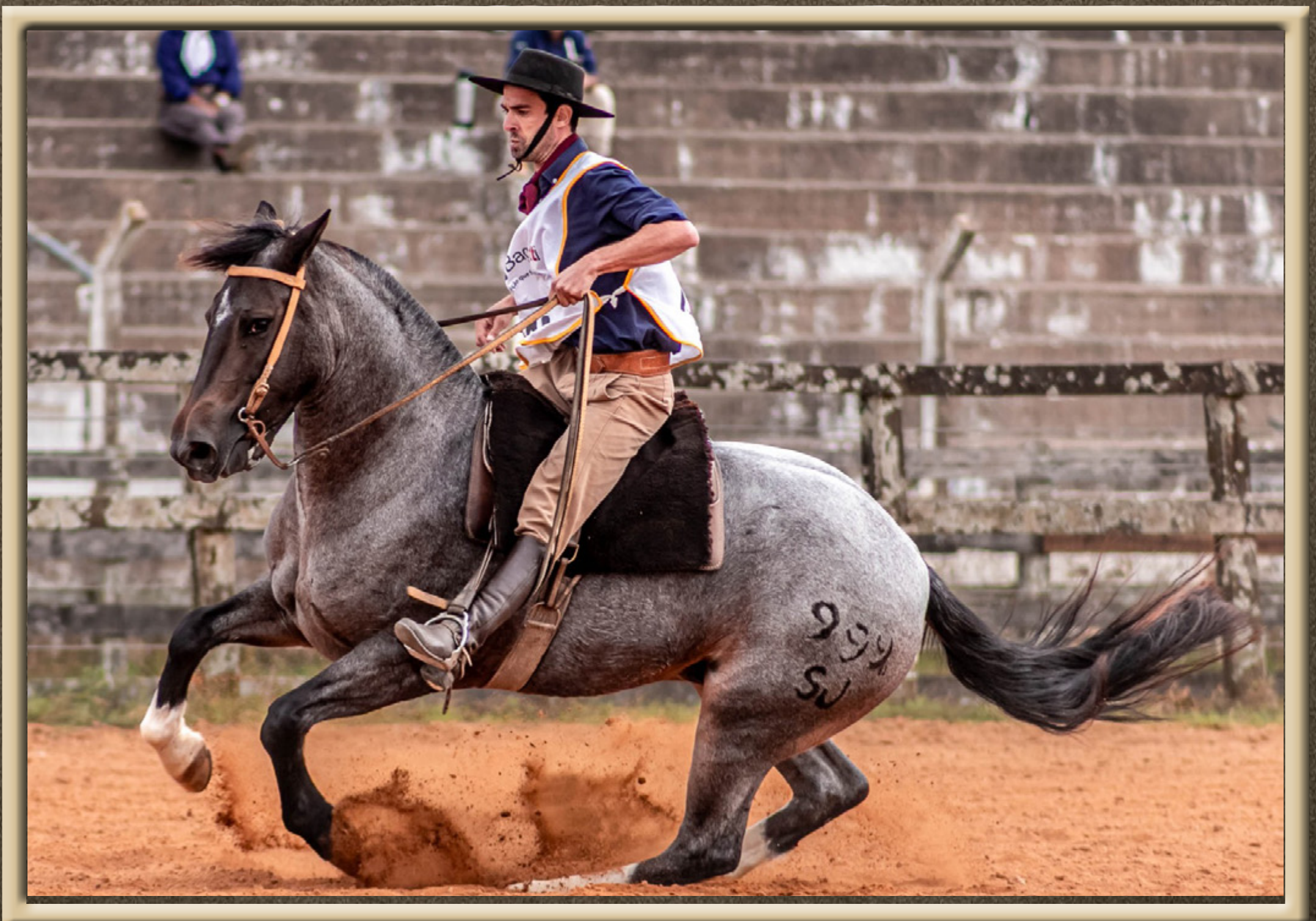
SJ LUTA SJ FESTEJO X ITALIANA II DO ACEGUÁ