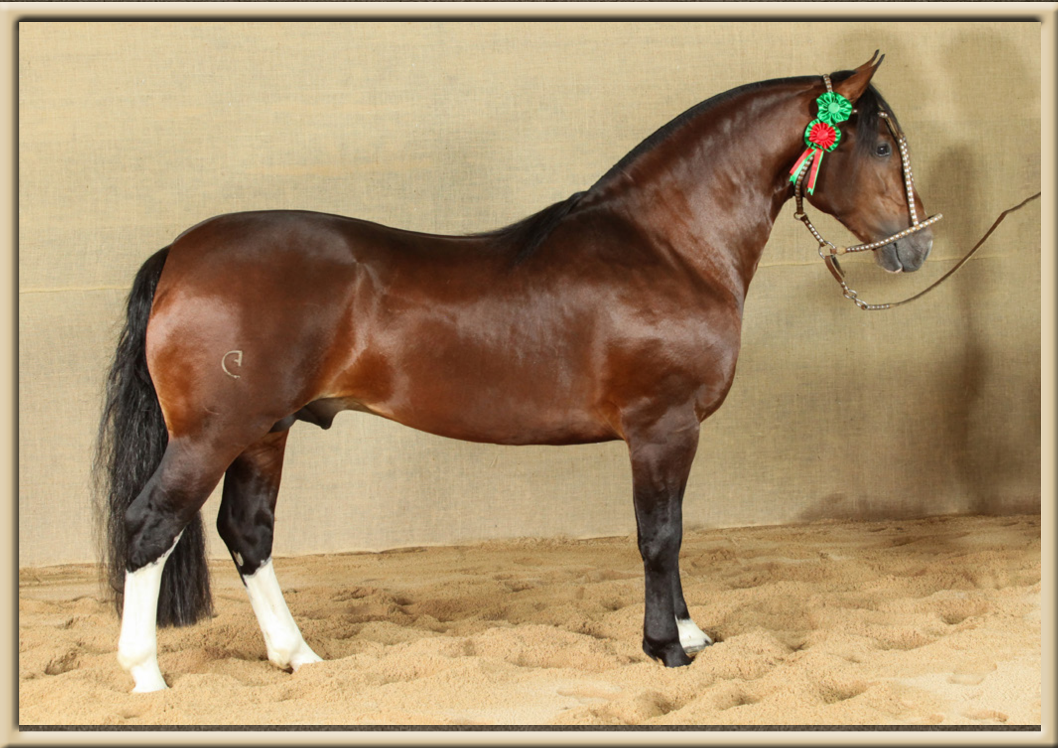
SJ NACO SJ FESTEJO X SJ IBÉRICA