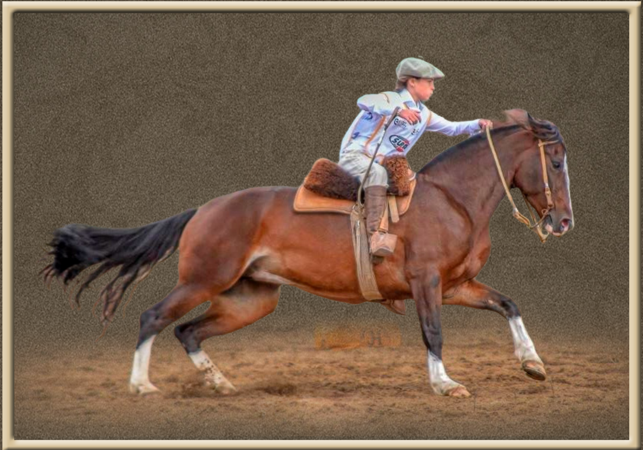
SJ LA BAMBA SJ FESTEJO X SJ DONZELA