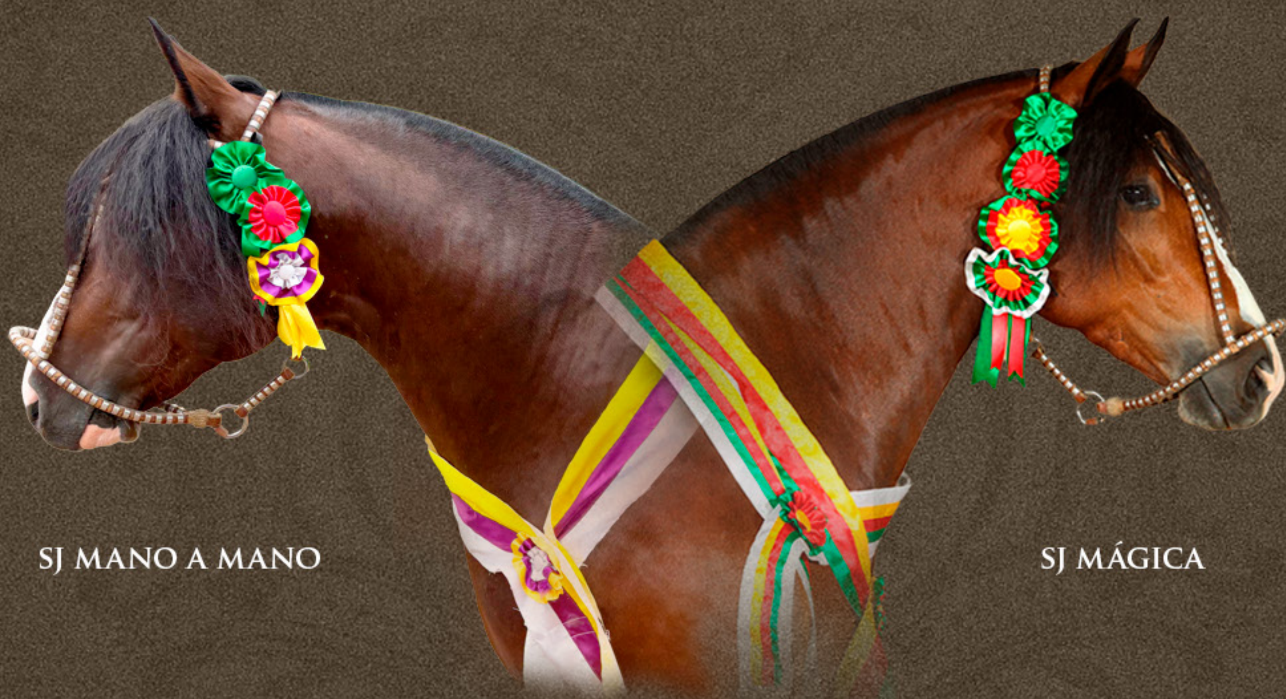
SJ MANO A MANO