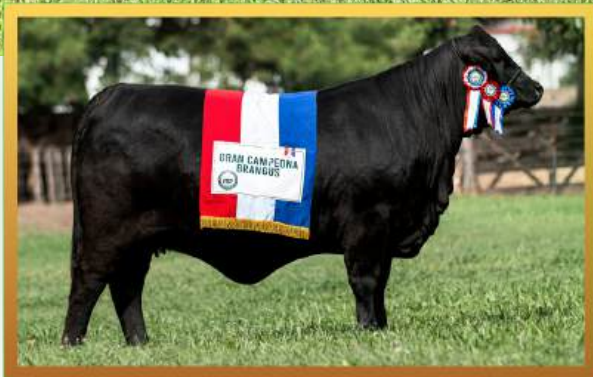
FILHA, GRANDE CAMPEÃ EXPO MRA 2022.

*ENTREGA FUTURA, PREVISÃO DE CHEGADA: JUNHO/JULHO 2026