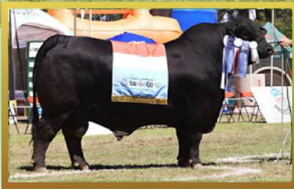
FILHO, GRANDE CAMPEÃO EXPO BRA 2022.