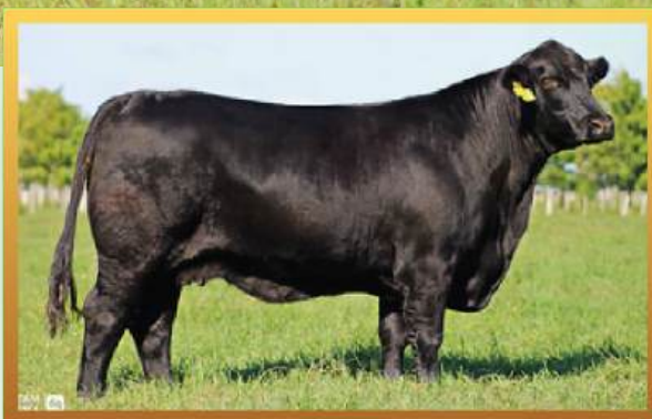
CUPÉ 1226 (MÃE).