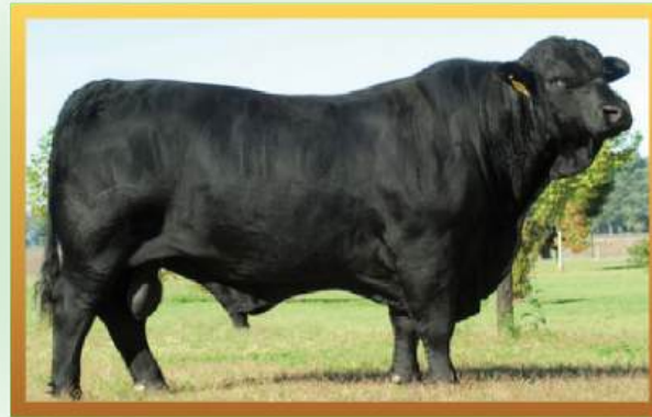
AONIKENK (AVÔ PATERNO).