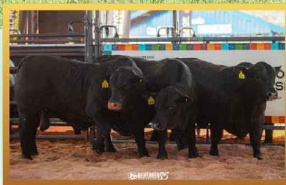
FILHOS, TRIO RES. GRANDE CAMPEÃO MUNDIAL BRANGUS 2026.