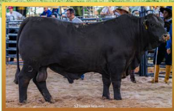
FILHO, MELHOR MACHO DE LOTES MUNDIAL BRANGUS 2026.