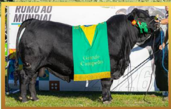
FILHO, GRANDE CAMPEÃO URUGUAIANA 2025.