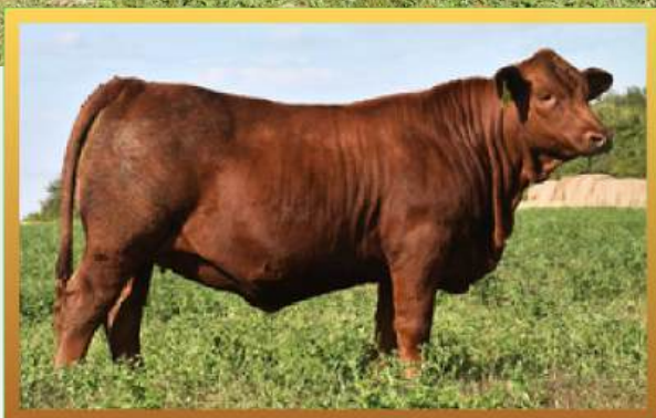
FILHA, CABANHA DON PANCHO.