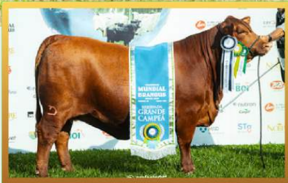
FILHA, RES. GRANDE CAMPEÃ ARGOLA MUNDIAL BRANGUS 2026.

PREÇO PACOTE ELITE BRANGUS: R$ 70,00 / DOSE (100 DOSES)