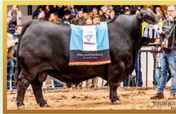
FILHO, G. C. NACIONAL E PALERMO 2025.