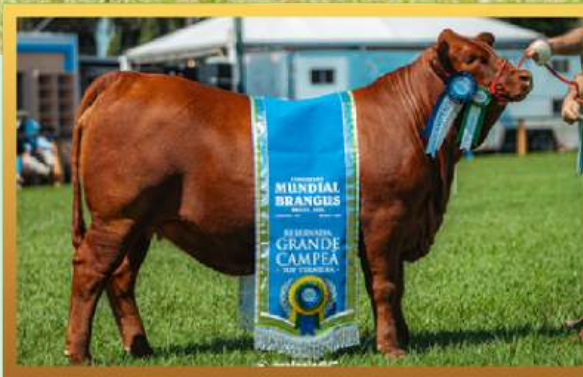
FILHA, RES. GRANDE CAMPEÃ TERNEIRA ARGOLA MUNDIAL BRANGUS 2026.