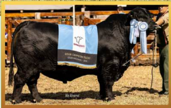
BALDOMERO, GRANDE CAMPEÃO MACHO NACIONAL (ARG) 2024.

OFERTA: 100 DOSES *ENTREGA FUTURA, PREVISÃO DE CHEGADA: JUNHO 2026