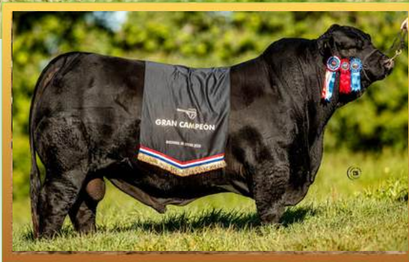
IRMÃO MATERNO, GRANDE CAMPEÓN NACIONAL DE OTOÑO (PAR) 2026.