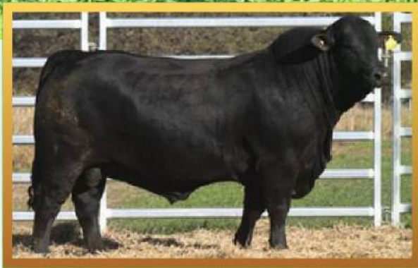
CHOCON, PREÇO MÁXIMO LEILÃO EXPO BRA 2023.