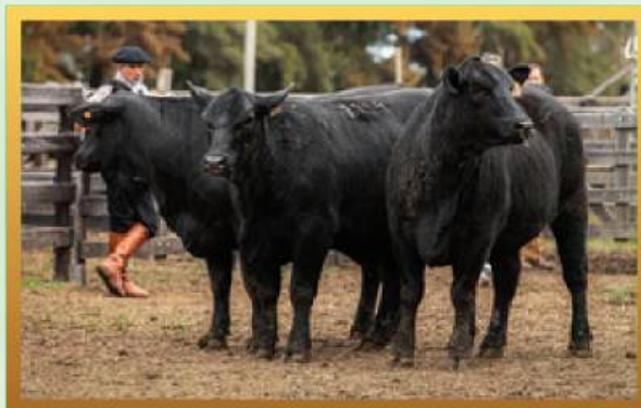
FILHAS, 3º MELHOR TRIO FÊMEAS RÚSTICAS URUGUAIANA 2023.