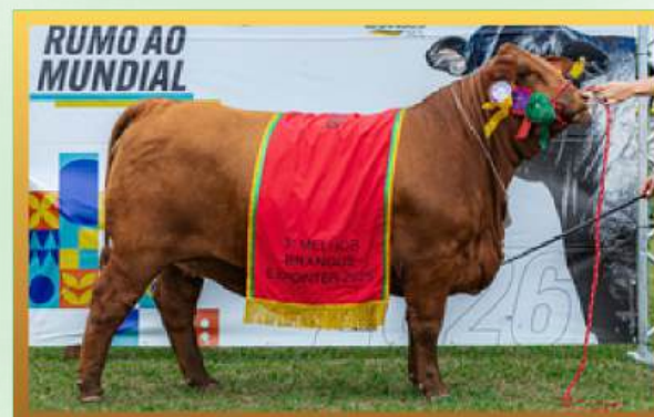
FILHA, 3ª MELHOR FÊMEA EXPOINTER 2025.