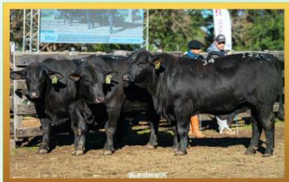
FILHOS, TRIO RES. GRANDE CAMPEÃO MACHOS RÚSTICOS URUGUAIANA 2024.