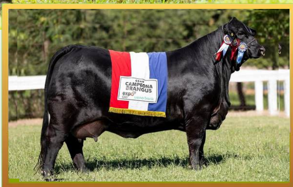
IRMÃ PATERNA, BRANGUS MISS WORLD 2025.