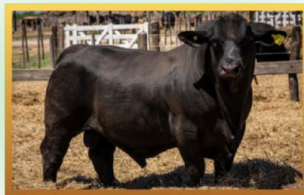
FILHO, CABANHA LAS DOS A.