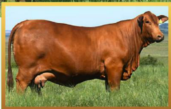
FILHA, GRANDE CAMPEÃ FÊMEA RÚSTICA INDIVIDUAL URUGUAIANA 2025.