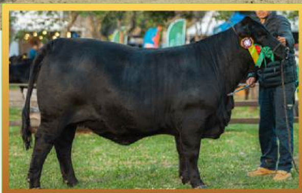
FILHA, 3ª MELHOR FÊMEA URUGUAIANA 2024.