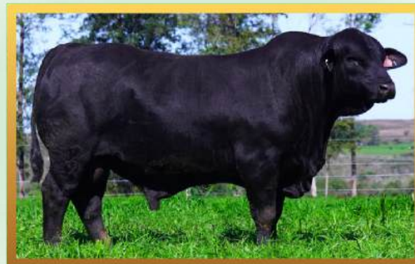
FILHO, ESTÂNCIA GUARITA.