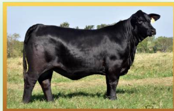
PUKAVY COCO CHANEL (MÃE).