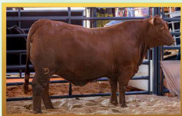
FILHA, RES. GRANDE CAMPEÃ FÊMEA RÚSTICA INDIVIDUAL MUNDIAL BRANGUS 2026.