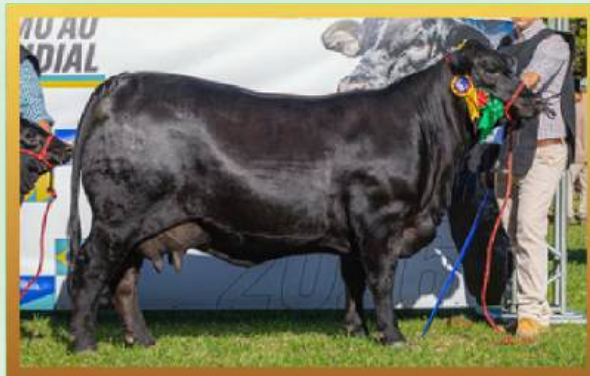
FILHA, 3º MELHOR FÊMEA ARGOLA URUGUAIANA 2025.