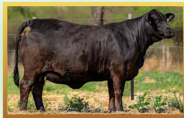
FILHA, CORRAL DE GUARDIA.