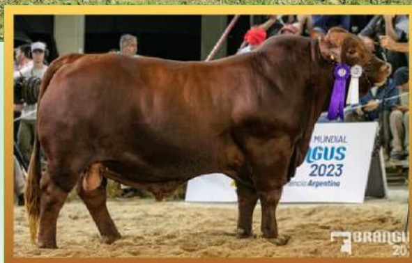
FILHO, RES. CAMPEÃO TOURO DOIS ANOS MAIOR MUNDIAL BRANGUS (ARG) 2023.