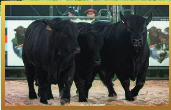
FILHOS, TRIO GRANDE CAMPEÃO MACHOS MUNDIAL BRANGUS 2026.