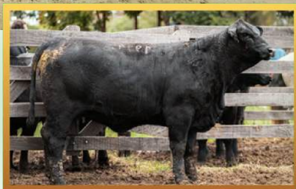
FILHA, MELHOR FÊMEA DE LOTES URUGUAIANA 2023.