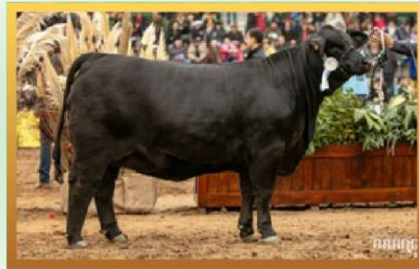
FILHA, CAMPEÃ TERNEIRA MAIOR PALERMO 2024.