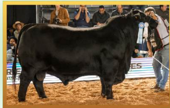
FILHO, CAMPEÃO TOURO SÊNIOR NACIONAL (ARG) 2024.