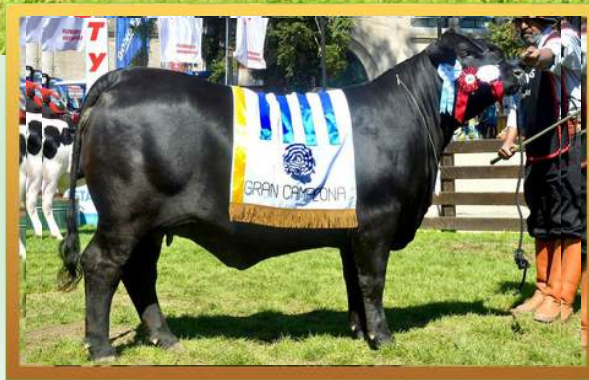
FILHA, GRANDE CAMPEÃ PRADO (URU) 2017.