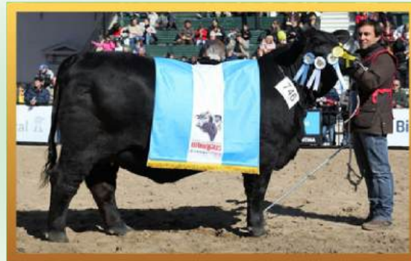
CORRALERA 9654 ELENA (AVÓ MATERNA).