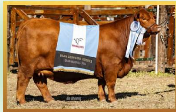
FILHA, GRANDE CAMPEÃ NACIONAL (ARG) 2024.