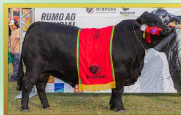
FILHO, 3ª MELHOR MACHO EXPOINTER 2025.