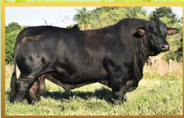
BLUE LABEL (PAI).