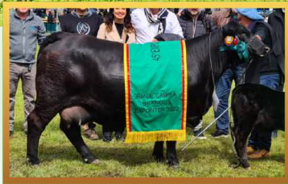
FILHA, GRANDE CAMPEÃ FÊMEA EXPOINTER 2022.