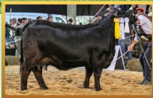
FILHA, 3ª MELHOR FÊMEA ARGOLA MUNDIAL BRANGUS (ARG) 2023.