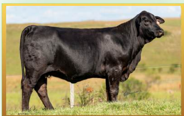
FILHA, ESTÂNCIA GUARITA.