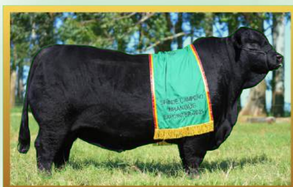
FILHO, GRANDE CAMPEÃO MACHO EXPOINTER 2025.