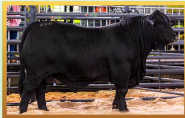
FILHO, GRANDE CAMPEÃO RÚSTICO INDIVIDUAL MUNDIAL BRANGUS 2026.