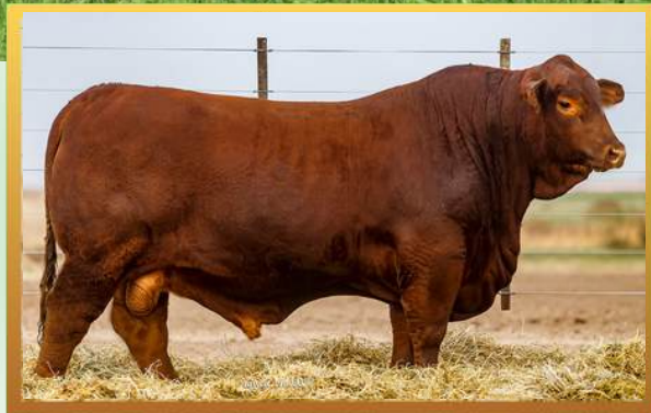
FILHO, RANCHO GRANDE.