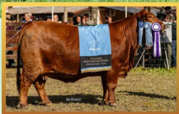
FILHA, RES. GRANDE CAMPEÃ FÊMEA NACIONAL (ARG) 2024.