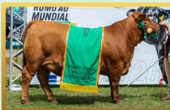
FILHA, GRANDE CAMPEÃ FÊMEA EXPOINTER 2025.