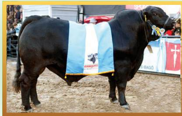
CASSIUS CLAY (AVÔ MATERNO).