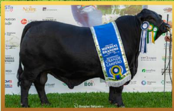
FILHO, RES. GRANDE CAMPEÃO ARGOLA MUNDIAL BRANGUS 2026.