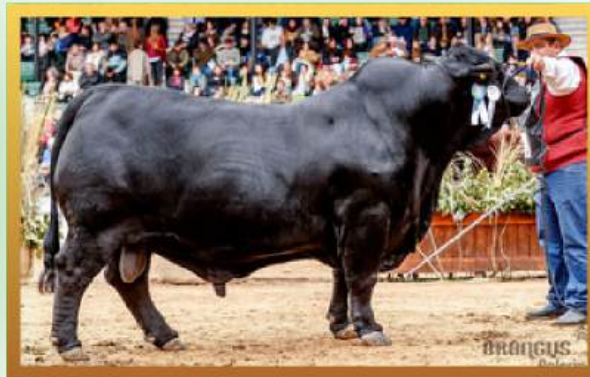
FILHO, CAMPEÃO TOURO SÊNIOR PALERMO 2025.