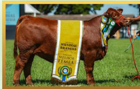
FILHA, 3ª MELHOR TERNEIRA ARGOLA MUNDIAL BRANGUS 2026.