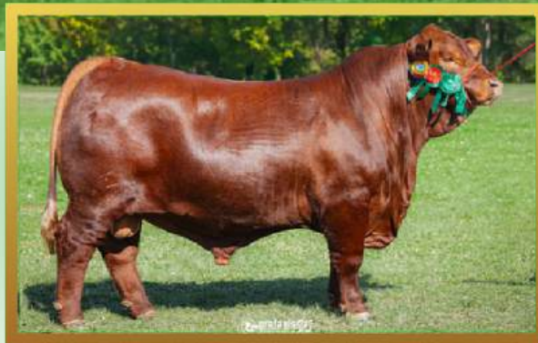
FILHO, GRANDE CAMPEÃO EXPOINTER 2024.