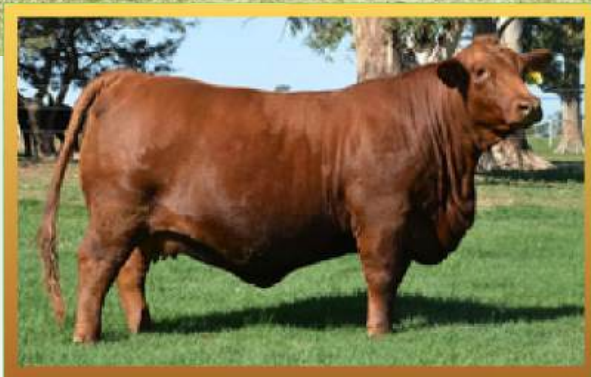
IRMÃ INTEIRA, CAB. DON PANCHO.