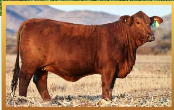
FILHA, RANCHO GRANDE.