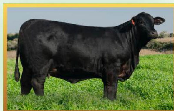
FILHA, ESTÂNCIA GUARITA.