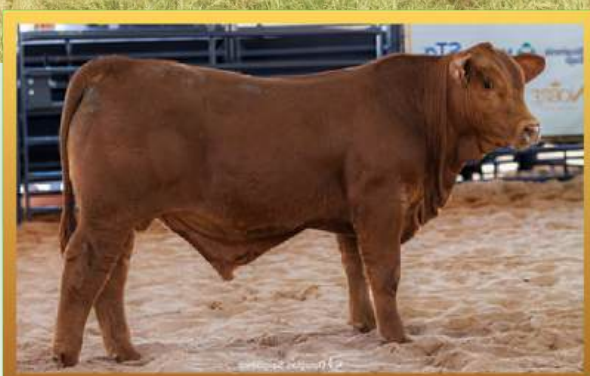
FILHO, RES. GRANDE CAMPEÃO TERNEIRO RÚSTICO INDIVIDUAL MUNDIAL BRANGUS 2026.