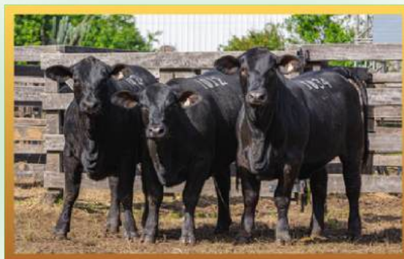
FILHAS, TRIO RES. GRANDE CAMPEÃO TERNEIRAS URUGUAIANA 2025.