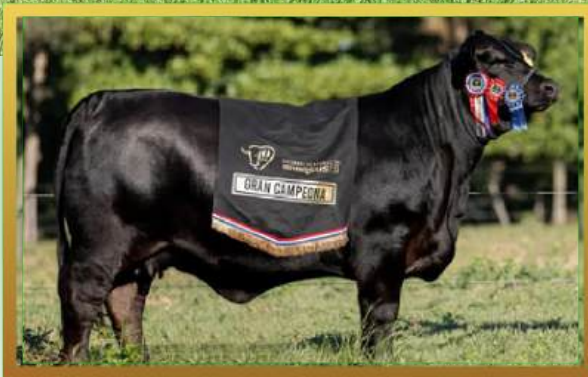
FILHA, GRANDE CAMPEÃ NACIONAL PARAGUAI 2023.