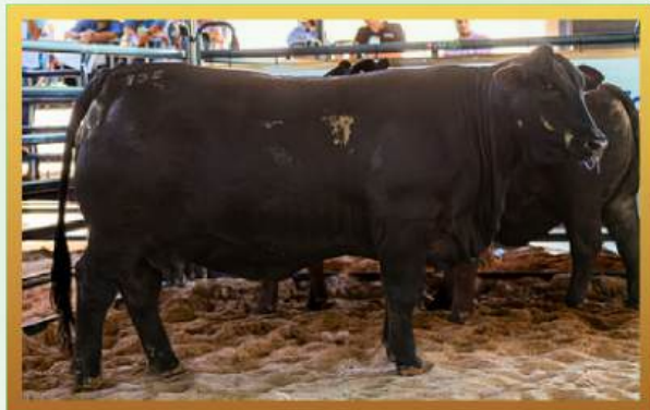
FILHA, GRANDE CAMPEÃ RÚSTICA INDIVIDUAL MUNDIAL BRANGUS 2026.