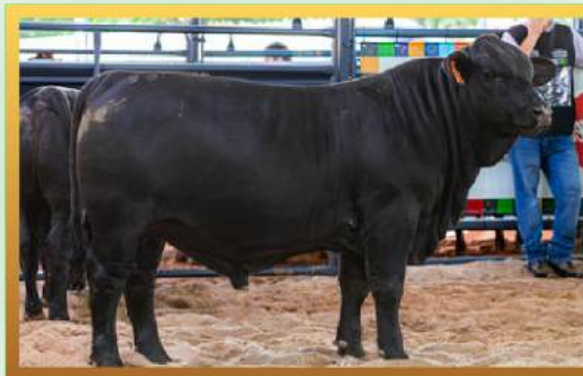
FILHO, GRANDE CAMPEÃO TERNEIRO RÚSTICO INDIVIDUAL MUNDIAL BRANGUS 2026.