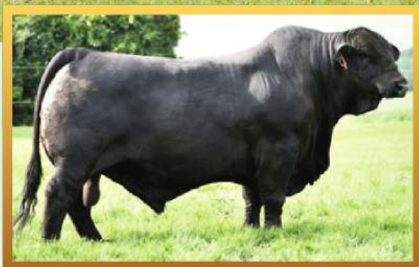
TEXAS STAR (PAI).