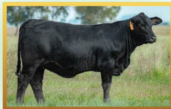
FILHA, RINCON DEL SARANDY.