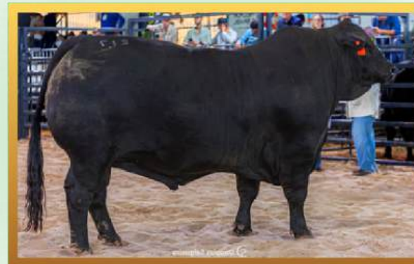
FILHO, RES. GRANDE CAMPEÃO RÚSTICO INDIVIDUAL MUNDIAL BRANGUS 2026.