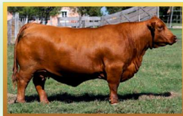
FILHA, CABANHA DON PANCHO.