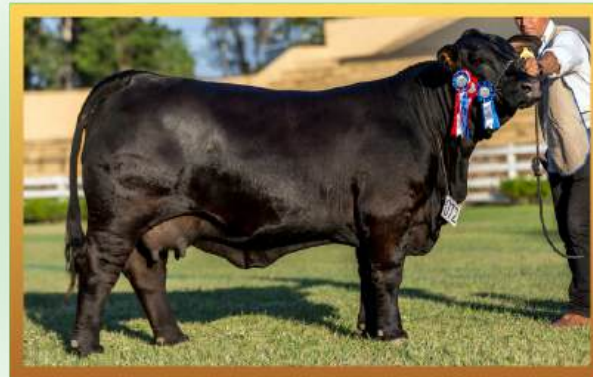
PUKAVY SHERAZADE (MÃE).