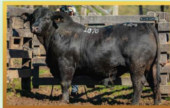
FILHO, MELHOR MACHO RÚSTICO DE LOTES URUGUAIANA 2024.