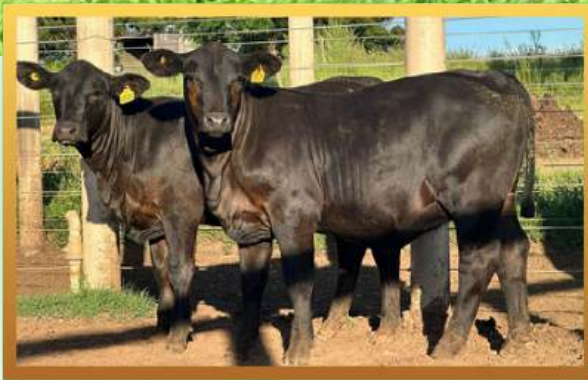
PROGÊNIES, RINCON DEL SARANDY.