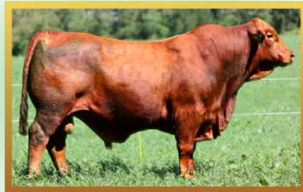
FILHO, GENÉTICA PROGRESSO.