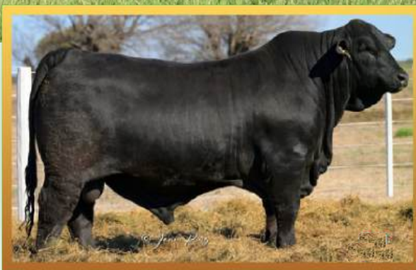
FILHO, CORRAL DE GUARDIA.