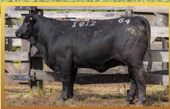
FILHA, MELHOR TERNEIRA DE LOTES URUGUAIANA 2025.