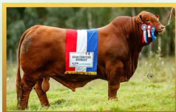
FILHO, BRANGUS CHAMPION OF THE WORLD E ALL BREEDS SUPREME 2024.