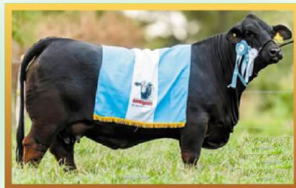
FILHA, GRANDE CAMPEÃ NACIONAL (ARG) 2021 E BRANGUS MISS WORLD 2021.