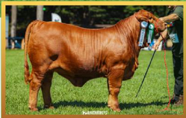
FILHA, 3º MELHOR TERNEIRA INTERMEDIÁRIA MUNDIAL BRANGUS 2026.