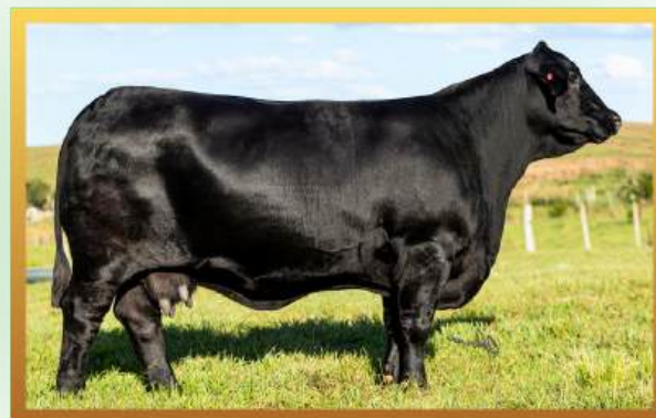
FILHA, GRANDE CAMPEÃ EXPOINTER 2017.