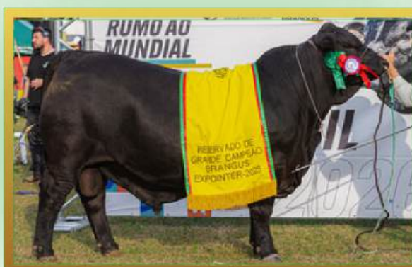
FILHO, RES. GRANDE CAMPEÃO MACHO EXPOINTER 2025.