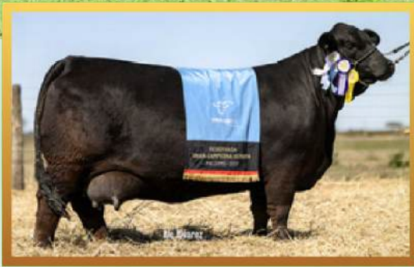
FILHA, RES. GRANDE CAMPEÃ PALERMO 2025.