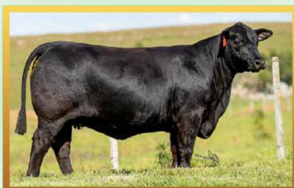
FILHA, ESTÂNCIA GUARITA.