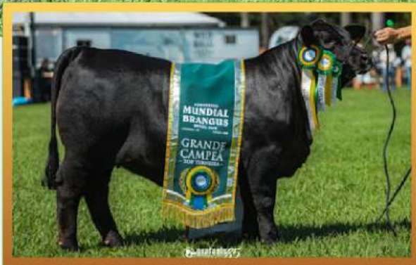
FILHA, SUPREMA GRANDE CAMPEÃ TERNEIRA MUNDIAL BRANGUS 2026.