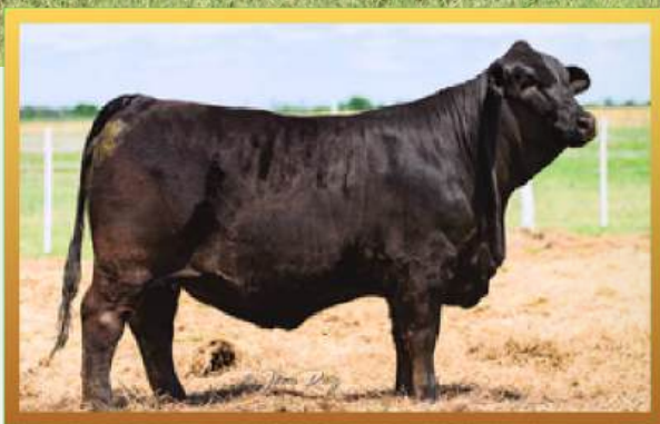
FILHA, CORRAL DE GUARDIA.