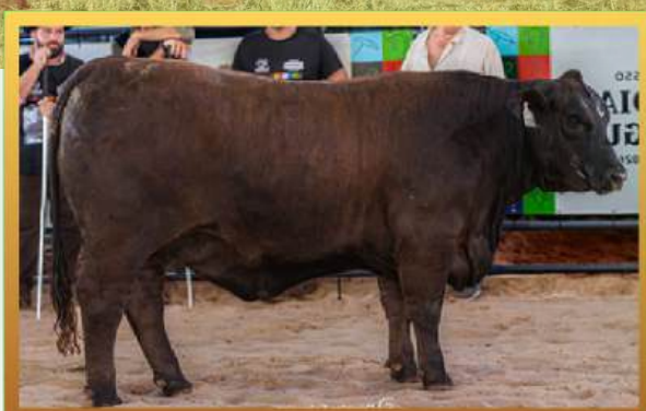
FILHA, 3º MELHOR FÊMEA RÚSTICA INDIVIDUAL MUNDIAL BRANGUS 2026.