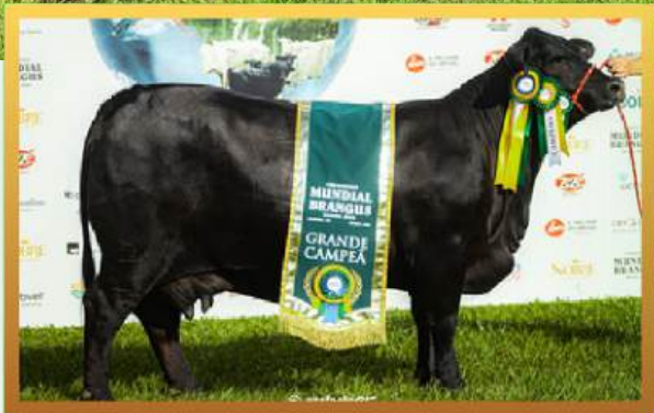
FILHA, SUPREMA GRANDE CAMPEÃ MUNDIAL BRANGUS 2026.

PREÇO PACOTE ELITE BRANGUS: R$ 50,00 / DOSE (50 DOSES)